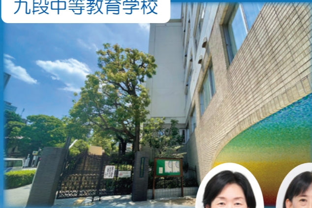
九段中等教育学校