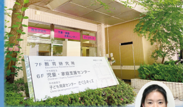
児童・家庭支援センター