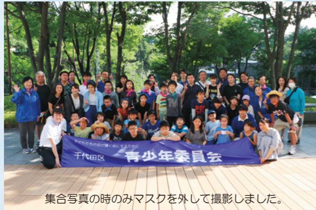
集合写真の時のみマスクを外して撮影しました。