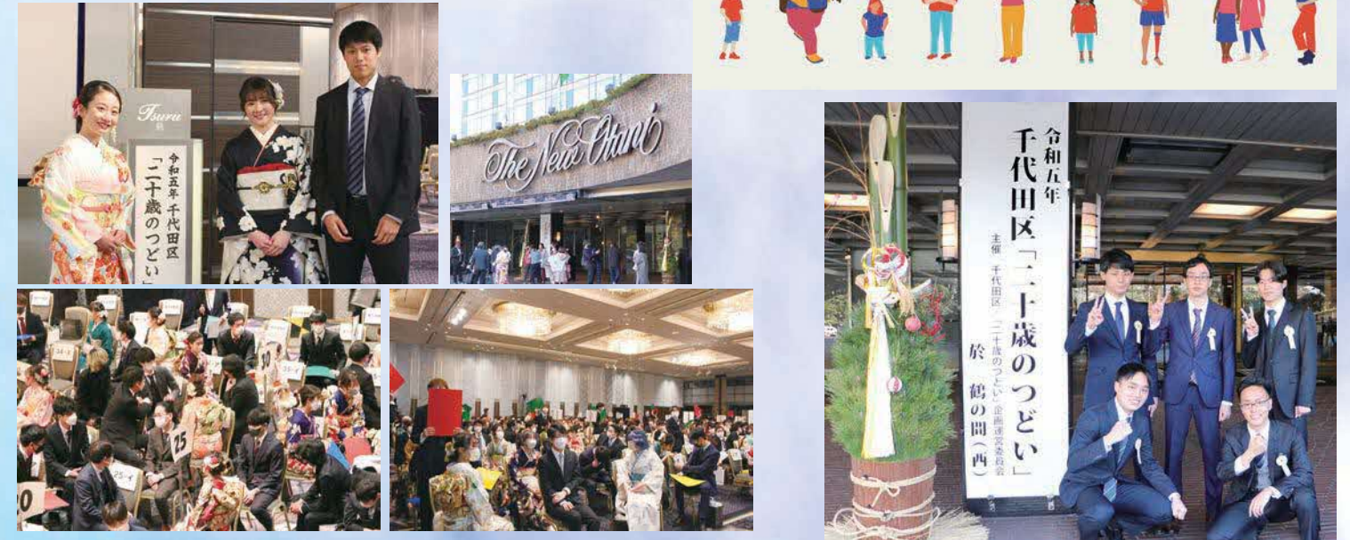
〈アトラクション〉 チーム対抗クイズバトル ☆ 二十歳の主張