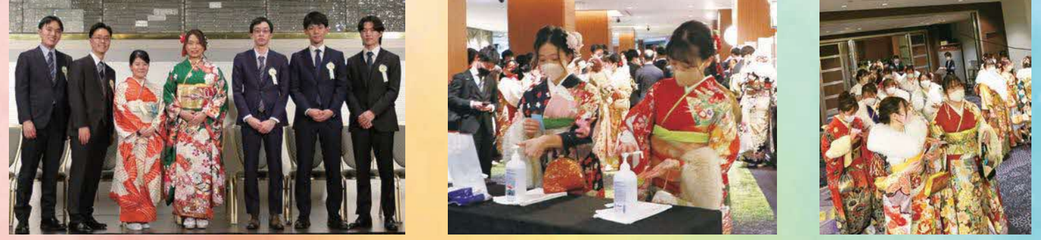
二十歳のつどい企画運営委員のみなさん 入場の際、手指消毒・検温