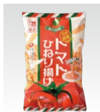
トマトひねり揚げ