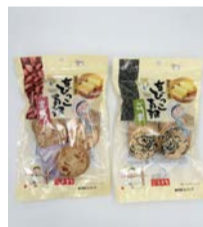
ちびっこ南部(まめ、ごま)

■問合せ ちよだグルメショップ+A 千代田区神田錦町3-21 ちよだプラットフォームスクウェア1階 ☎5577-3846 (12時～18時) ✉chiyoda.gshop.plusA@gmail.com