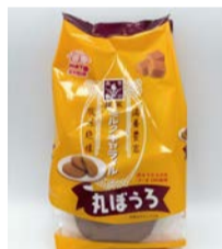
キャラメル丸ぼうろ