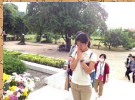
▲亡くなった方々へ祈りをささげる (刑場跡のキリング・フィールド)