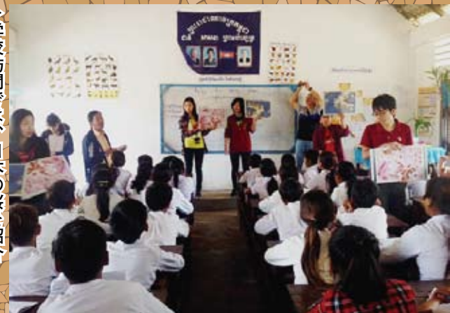
▶学校訪問では、日本の桜を紹介