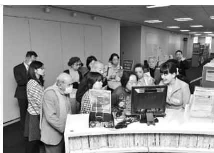
▲区政モニター庁舎見学会

区政モニターは、皆さんが区政について日頃感じていることや意見等を区が広く聴き、区政運営に反映させる制度です。 対象 20歳以上の区内在住・在勤・在学者(封書モニター/メールモニター)60名応募多数の場合選定 活動内容 ①区政に対する意見・要望・提案等の提出(随時) ②区政に関するアンケートの回答③広報紙「広報千代田」、映像広報「わがまち千代田」、区のホームページ等に関するアンケートの回答 ※アンケート調査は②③併せて年7回程度を予定。 任期 4月から1年間 謝礼 アンケートの回答1回につき図書カード500円分 ※謝礼の対象は②③のみ。 申込み 3月6日(金)までにハガキ・ファックスまたはEメール(7面記入例参照)職業・性別・応募の動機(100字程度)・モニターの種類(封書モニターまたはEメールモニター)・委嘱式への出席可否も記入で広報広聴課(〒102-8688 九段南1-2-1) ☎3239-8604 FAX 3239-8604 申込み monitor@city.chiyoda.tokyo.jp