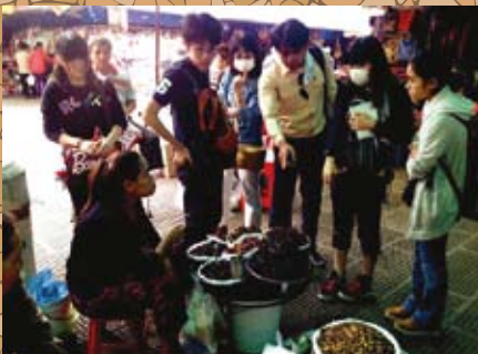
▲セントラルマーケットで市場価格の調査