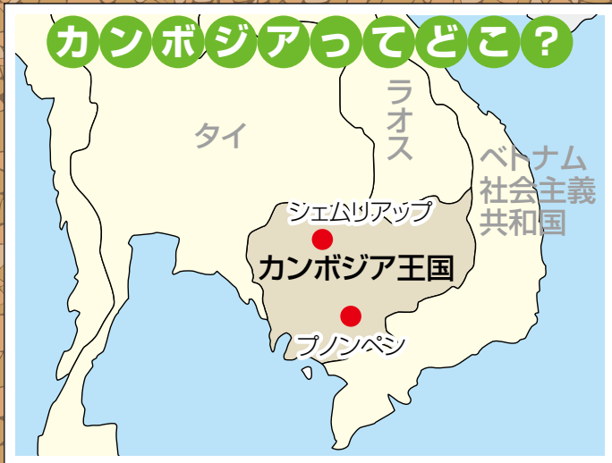
カンボジアってどこ？

※現地滞在中は、当日の日程終了後に滞在先のホテルや空港などでその日の体験を振り返り、気付いたことや学んだことを共有しました。遅いときは 22 時を過ぎても意見交換が続くこともありました。