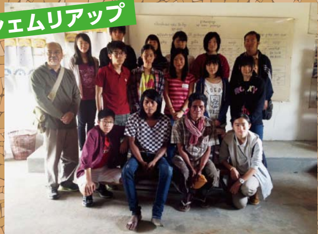
▲地雷被害者へのインタビュー