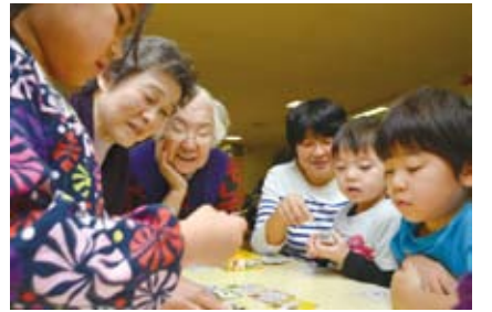
▲昔遊び交流会(千代田幼稚園)