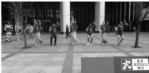
▲東京区政会館前での阿波踊り(昨年の様子)

2月22日(日)午前中の風ぐるま(※)は運休します。 *福祉施設を中心に区内を運行している「乗合タクシー」です。