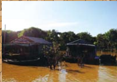
▲湖上で暮らす生活者を視察(トンレサップ湖)