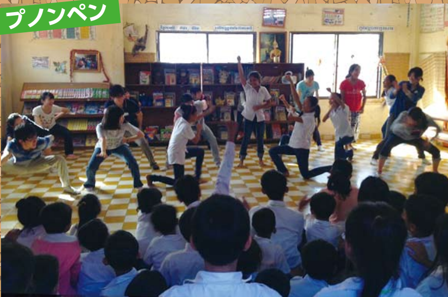
▲ソーラン節を披露 踊りに参加する女の子も登場