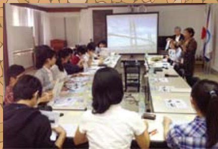
▲ JICA カンボジア事務所を訪問