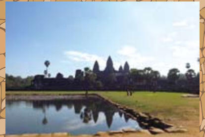
▲世界遺産のアンコールワット