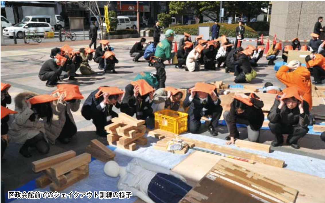
区公会館前でのシェイクアウト訓練の様子

3月11日(水)で東日本大震災から4年が経ちます。区は大震災の教訓を忘れず、地震発災時の「自助」の大切さを啓発するため、一斉防災訓練(シェイクアウト訓練)を実施します。この訓練を家庭や職場等で実施し、日頃の防災対策を再点検しましょう。 問合せ 防災・危機管理課 ☎5211 - 4187