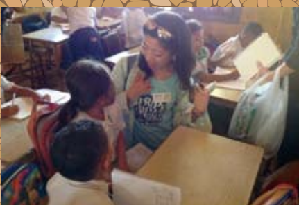
▲現地の子どもたちと交流 (オグラトロケアット小学校)