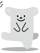
千代田区 2010 消費生活センター イメージキャラクター 「キックン」

・頻繁に見慣れない人の出入り や物(カタログ・名刺・領収 書等)が目につく。 ・不審な電話のやり取りや電話 口で困っている様子が見受け られる。