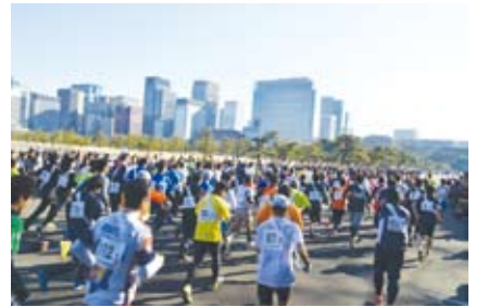
▲第65回千代田区内壕周回駅伝大会

田区社会福祉協議会地域福祉係(☎5282-3711 FAX5282-3718) chiki@chiyoda-cosw.or.jp)へ。