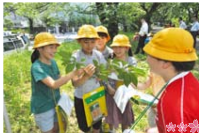
▲富士見小学校児童による調査

外濠公園のさくらの状態を1年かけて調べ、さくらへの想いを次世代につなげています。