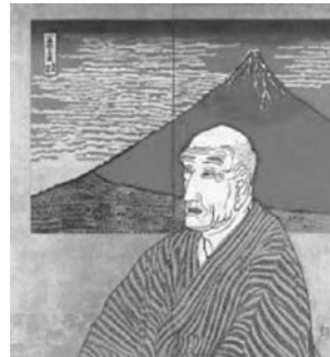
▲《面構 葛飾北斎》1971(昭和46)年 神奈川県立近代美術館

1 図書展示「浮世絵にみる江戸と芸術」 時5月15日(金)まで 場2階図書フロア(パープルゾーン)、3階ホール(ガラスケース) 内江戸時代の人々にとって、現代の新聞や雑誌のように身近な紙メディアであった浮世絵の魅力を紹介。 2 展覧会への入口講座 Vol.14 ここが面白い!片岡球子の人と作品 時4月9日(水)19時～20時30分(受付18時30分～) 場地下1階日比谷コンベンションホール(大ホール) 定200名(申込順) 内片岡球子(日本画家)のエネルギッ