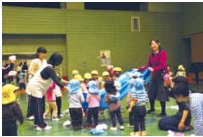
▲かんたんふれあいあそび (いずみこども園)