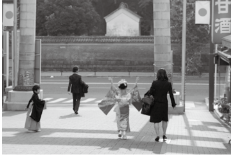
▲昨年のグランプリ(千代田区観光協会会長賞)

平成26年5月～平成 27年4月に千代田区内で撮影 された作品(第三者の肖像権・ 著作権等の権利を侵害しない を)ご覧ください。