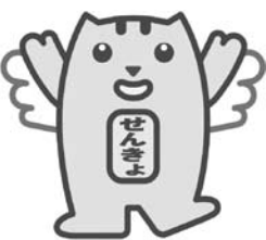
▲明るい選挙キャラクター「選挙のめいすいくん」

任期満了に伴う「千代田区議会議員選挙」が4月26日(日)に行われます。大切な一票を無駄にせず、必ず投票しましょう。 告示日 4月19日(日) 投・開票日 4月26日(日) 郵便等による不在者投票 身体障害者手帳、戦傷病者手帳または介護保険被保険者証をお持ちの方で、障害や要介護の程度が法令で定められた等級に該当する方(下表)は、郵便等により不在者投票ができます。詳しくはお問い合わせください。 ※「郵便等投票証明書」の交付手続に時間がかかります。早めにお問い合わせください。 ※すでに「郵便等投票証明書」をお持ちの方には「投票用紙の請求書」を郵送します。 問合せ 選挙管理委員会事務局 ☎5211-4268