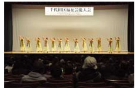
▲福祉芸能大会(共立講堂)

組目以降は自己負担) ※身体障害者手帳3・4級、愛の手帳3度の方がいる世帯は、半額自己負担 問合せ ①②の方=在宅支援課在宅支援係 ☎5211-4220 ③の方=生活福祉課障害者福祉係 ☎5211-4214