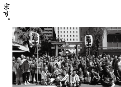
▲地元の地域活動にも参加

した。平成12年夏には、「都市住宅とまちづくり研究会」を設立し、同年11月にNPO(特定非営利活動法人)として認証されました。