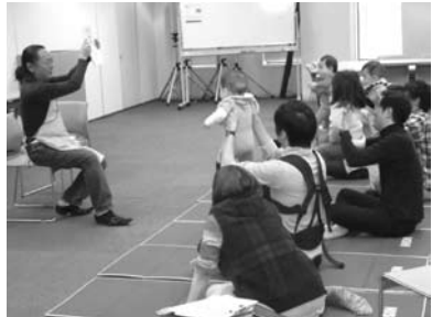
▲昨年実現した講座(夫婦向けの「絵本の読み聞かせ」)

ナリの模範となった同校へ感謝状を授与しました。写真見せ 問合せ 神田警察署 ☎3295-0110