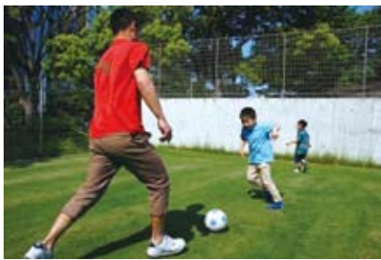
▲ 4月から5か所でボール遊び