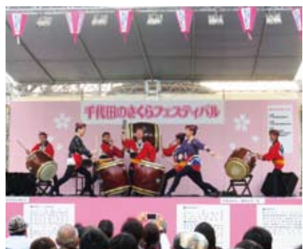
▲昨年のステージの様子