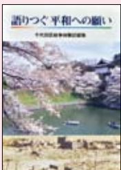
▲平成9年に作成した戦争体験記録集

い世代の方が、戦争体験者へのインタビューを通じて生の体験・声を聞き、記録集にまとめます。また、完成した記録集を学校の平和授業等で使用することで、戦争体験を次の世代へ引き継ぎ、国際平和を啓発します。