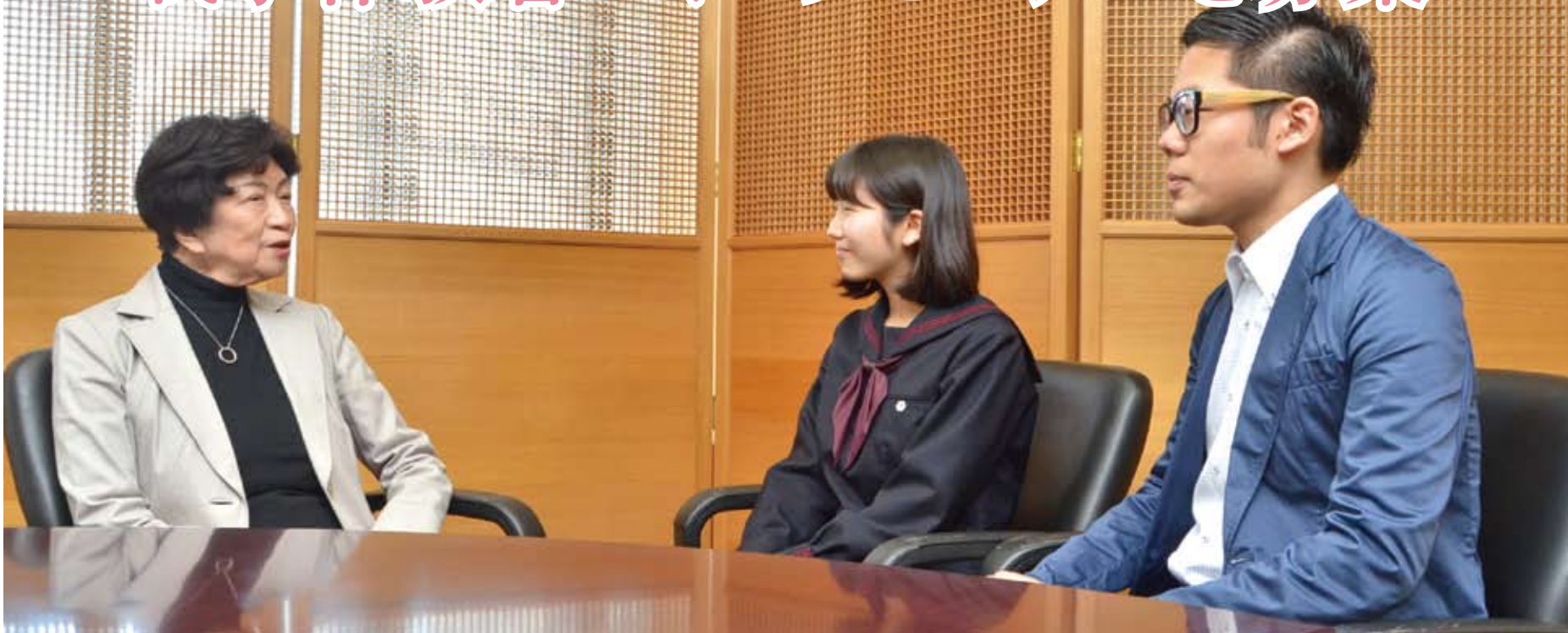
▲募集に先立ち、戦争体験者へのインタビューの様子(千代田区役所)