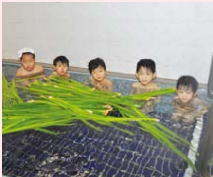
▲この1年が健康でありますように