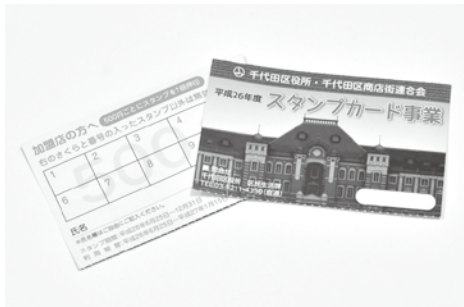
▲昨年のスタンプカード

スタンプカード事業は、加盟店で買い物・食事などをした際に、500円ごとにスタンプ1個が押され、10個になると加盟店で500円の金券として利用できるのです(7月開始予定)。 この事業の加盟店に登録し、地域に身近でお得なお店になりませんか。加盟店一覧は、区の