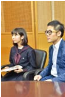
▶平成26年度平和使節団に参加した団員がインタビュー

今回のインタビューで当時の知らなかった出来事などを知る事ができました。私たちがとって戦争と言うと遠い存在に感じていたのですが、とても良い経験が出来たと思います。 言葉としては知っていても、実際に経験した訳では無いので、実際に経験された方のお話を聞いて良かったです。 今回作られる記録集も、こうした方々の貴重な体験