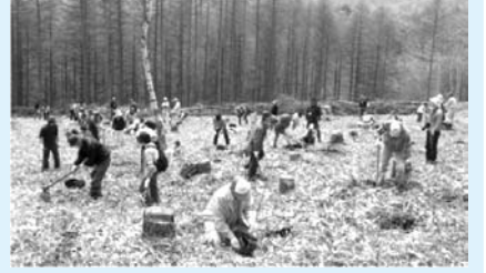
▲昨年の植樹の様子

申5月7日(必着)までに郵送・ファクスまたはEメール(6面記入例参照/参加者全員の性別も記入)で環境政策課事業推進係(〒102-8688九段南1-2-1) FAX3264-8956 kankyouseisaku@city.chiyoda.lg.jpへ。 問☎5211-4253