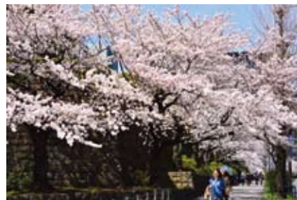
▲桜のトンネル（最高裁判所前）