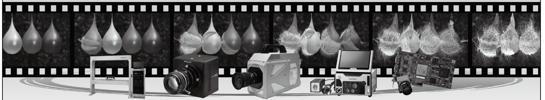
フォトロン製ハイスピードカメラは、世界中の研究開発施設・学術施設・生産現場で活躍しています。

フォトロンは、メーカーとして、画像にこだわった技術や製品を企画・開発し続けます。社会の役に立つ限り、他の追随を許さない所まで深く追究しつづけます。あくまで独創的で、他社の真似をしないということにプライドを持ちます。お客様の要求をお聞きし、それを参考にして新しい製品を創造し、新しい技術にも果敢に挑戦します。それらの全てを財産とし、継承し、画像にこだわりつづける会社を目指します。