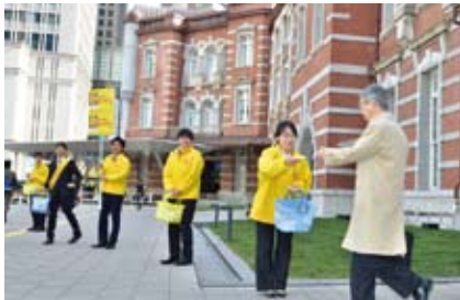
▲新規職員が生活環境条例キャンペーン