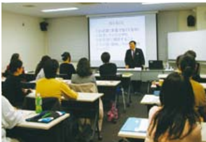
▲昨年の千代田ビジネス起業塾の様子

申込 ・お電話にて予約状況をご確認ください。 ・実施日の2日前の正午までにご予約ください。 ・相談内容は、ビジネス法律相談に限ります。 問合せ 産業まちづくりグループ ☎3233-7558