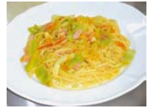
▲平成26年最優秀作品「今日味忘らさずパスタ」

コシステム(CES)推進協議会のホームページからダウンロード)でファクスまたはホームページで千代田エコシステム(CES)推進協議会(FAX 5211-5085 http://chiyodaces.jp )へ。 問 ☎5211-5085