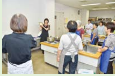
▲料理教室を実施した推進員

健康づくり推進員は、区の委嘱を受けた健康づくりに関心のある区民です。体操や健康吹き矢など、さまざまな活動を自主的に行っています=表1・2。参加を希望する方は、お問い合わせください。