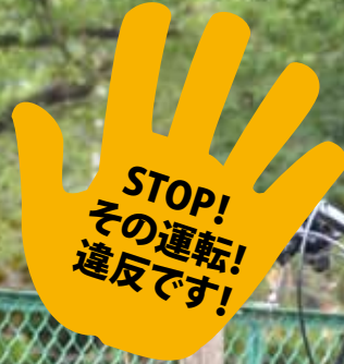
※違反行為の再現写真です。公道ではない場所で撮影しています。

自転車運転中に危険なルール違反を繰り返すと「自転車運転者講習」を受けることになります。