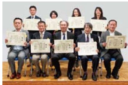
▲昨年度「第7回千代田ビジネス大賞」表彰式