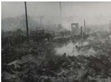
▲鎌倉町・旭町方面の火災被害地