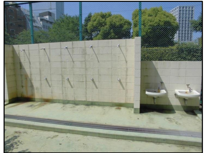
↑ 手洗い場、トイレ設置予定箇所