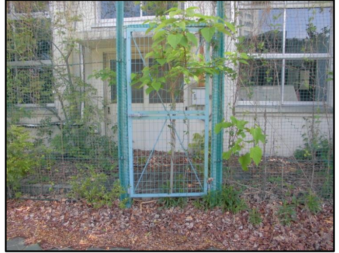
↑ フェンス（出入口は施錠）