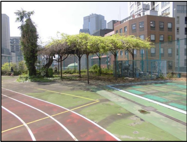
↑ 藤棚（日陰として利用）