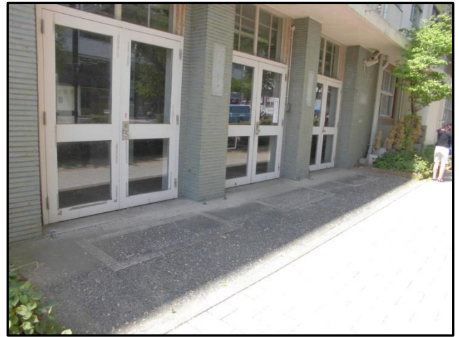
↑ 駐輪場設置予定箇所 （この場所を含め2か所設置予定）