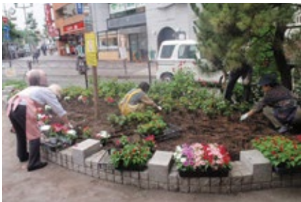
アダプトシステムへの参加