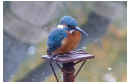
羽を休めるカワセミ