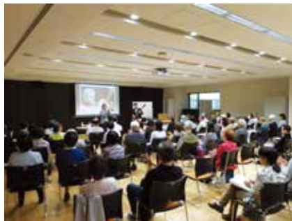
▲音楽学科「初級ジャズ講座」の様子