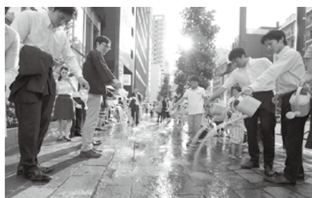
▲麹町大通りの打ち水