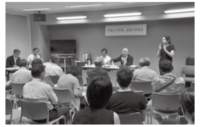
▲昨年度実施の様子

千代田区に住み・働き・学び・集う皆さんの生の声を、区長が直接お聴きします。事前の申し込みは必要ありません。直接会場にお越しください(手話通訳あり)。 とき ①7月27日(木)②8月3日(木)18時～20時(入退場自由) 会場 ①神保町区民館(神田神保町2-40)②麴町区民館(麴町2-1)