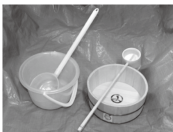
▲木おけ・ひしゃく・バケツ

打ち水は、自然の気化熱を利用して気温を下げる、昔からの手法です。ヒートアイランド現象によって暑くなった都心を冷やし、節電にもつながります。