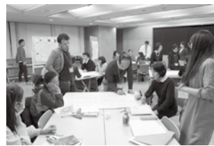
▲第1期の授業の様子

10月から開講するちよだ生涯学習カレッジ第2期の入学者を募集します。第一線で活躍する講師による独自のカリキュラムを通じ、地域活動につながる実践的な力を培う場となっています。この機会に地域活動について学び、濃密な2年間を過ごしませんか。 募集コース 学びと地域のコーディネートコース 就学期間 10月～平成31年7月(2年制) 授業日時 月2回程度(主に第1・3火曜)19時～21時 対象 次の条件をすべて満たす方30名(選考) ①20歳以上(平成29年10月1日現在) ②区内在住・在勤・在学 ③2年間継続して学ぶことができない 募集案内の配布場所 情報コーナー(区役所2階・出張所など) ※問合せ先のホームページからダウンロードもできます。 入学説明会開催 年間予定や申込方法を説明します。 とき 7月20日(木)、8月1日(火) 19時～20時30分(開場18時30分/当日直接会場へ) 会場 九段生涯学習館3階第1学習室(九段南1-5-10) 申し込み 8月17日(木)必着までに「ちよだ生涯学習カレッジ第2期2017年入学募集案内」に添付の入学願書に、作文「あなたにとって『学び』とは何をすることですか」を添えて、郵送・ホームページまたは直接問合せ先へ。 問合せ ちよだ生涯学習カレッジ ☎3234-2841 URL: http://www.kudan-ii.info/chiyodacollege 〒102-0074 九段南1-5-10 九段生涯学習館内