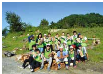
▲昨年の被災地ツアー

現地のさまざまな人達との交流や繰り返し行われたワークショップを通して、「一人でやれることは少ないけれど、みんなでつながって協力すれば被災地をいろいろと支援できる」と感じました。