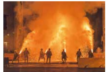
▲第7回千代田区民賞「大迫力」

募集作品 「いまを写す」をテーマに千代田区・荒川区・文京区内で撮影した写真 ※応募方法など詳しくは、問合せ先のホームページをご覧ください。 締8月31日(日)(必着) 問東京ケーブルネットワーク(株) ☎ 0800-123-2600 ①http://www.tcn-catv.co.jp