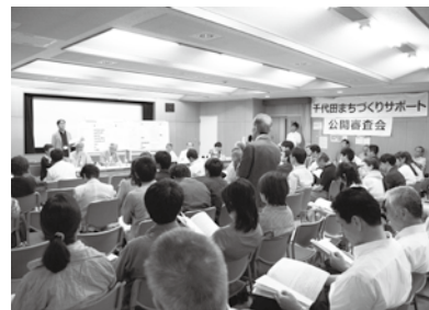
▲公開審査会の様子