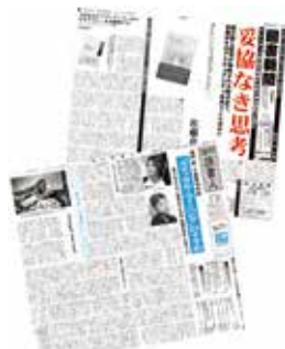
▲「週刊読書人」(左)と「図書新聞」(右)

■展示「書評紙が選ぶ、今すぐ読みたいベスト16～2大書評紙初の合同企画展～」 時7月24日(日)～10月21日(日) 場9階展示ウォール 内日本を代表する書評紙「週刊読書人」と「図書新聞」が、文学・芸術・サイエンスなど8つのカテゴリごとにベストな1冊をセレクト。夏休みや読書の秋にむけて16冊をパネルで紹介するほか、各紙推薦の計150冊を展示・貸し出し。 問千代田図書館 ☎ 5211-4289