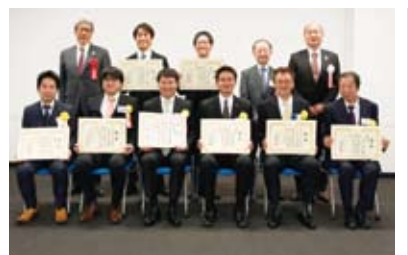
▲昨年度「第9回千代田ビジネス大賞」表彰式

「第10回千代田ビジネス大賞」のエントリー企業を募集します。 まちみらい千代田では、中小企業の発展を支援することを目的として、経営革新や経営基盤の強化に取り組んでいる企業や特徴ある優れた活動実績を上げている企業を表彰する「千代田ビジネス大賞」を実施しています。 千代田ビジネス大賞は、平成20年から始まり今年で10周年を迎え、エントリー数は累計300社以上、受賞企業は65社に上り、区内中小企業の発展に寄