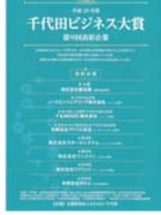
▲第9回千代田ビジネス大賞表彰企業冊子

「第10回千代田ビジネス大賞」のエントリー企業を募集します。 まちみらい千代田では、中小企業の発展を支援することを目的として、経営革新や経営基盤の強化に取り組んでいる企業や特徴ある優れた活動実績を上げている企業を表彰する「千代田ビジネス大賞」を実施しています。 千代田ビジネス大賞は、平成20年から始まり今年で10周年を迎え、エントリー数は累計300社以上、受賞企業は65社に上り、区内中小企業の発展に寄