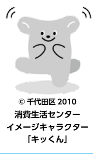
千代田区 2010 消費生活センター イメージキャラクター 「キックン」