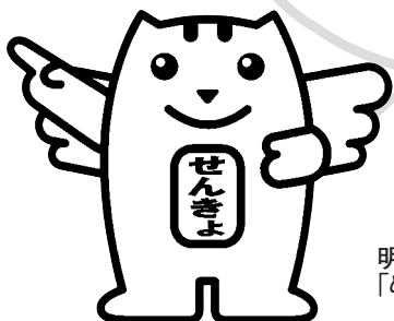
明るい選挙のイメージキャラクター「めいすいくん」