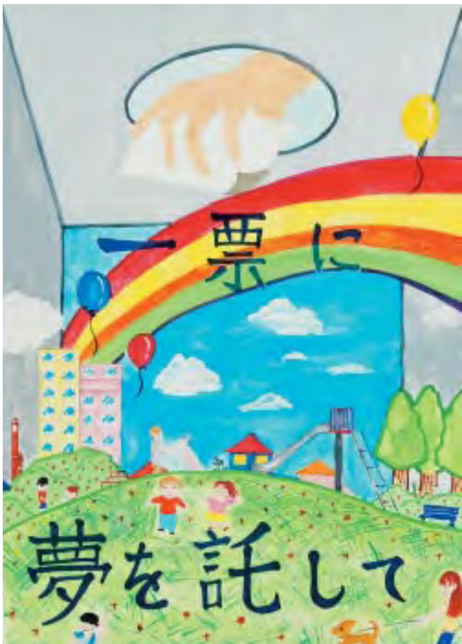
▲平成21年度千代田区明るい選挙推進協議会会長賞