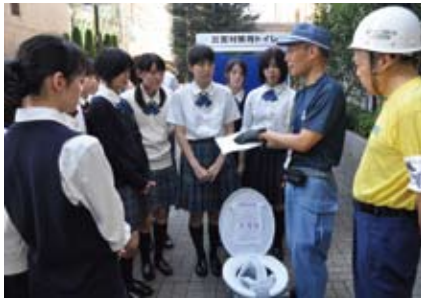
▲麴町三丁目防災訓練(麴町学園)