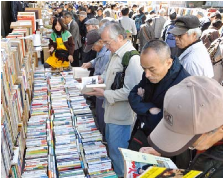
▲昨年の神田古本まつり