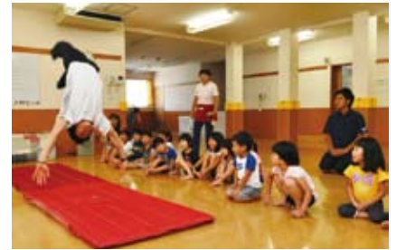
▲アテネ五輪金メダリスト米田功さんによる体操教室(麹町保育園)

■学校公開週間 都内の小学校に在学の児童とその保護者・教員・地域の方を対象に、学校を公開します。授業の様子や改修された2つの校舎をご覧ください。 10月17日(月)～22日(土)午前の部=8時～12時20分 / 午後の部=12時55分～15時15分(給食の時間を除く / 土曜は午前の部のみ)、九段中等教育学校九段校舎・富士見校舎(富士見1-10-14) —いずれも— 当日直接学校へ。詳しくは、学校のホームページをご覧ください。 九段中等教育学校 ☎3263-7190 URL http://www.kudan.ed.jp