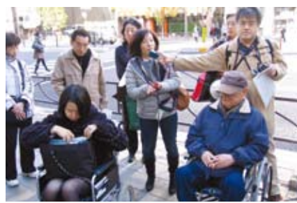
▲前回のさぼてんの様子

集合時間 9時50分 集合場所 アーツ千代田3331 正門前(外神田6-11-14) 参加費 無料 問合せ C S C (財)ちよだプラットフォームスクウェア4階 chiyoda.sapoten@yahoo.co.jp ※参加申し込みは不要です。当日集合場所にお集まり下さい。