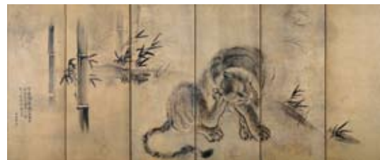
▲竹虎図屏風(左隻) 長谷川等伯 桃山時代 出光美術館蔵

11月10日(木)18時30分～20時、千代田図書館会議スペース(区役所10階)、定員20名(申込順)、講師=宗像晋作さん(出光美術館学芸員)、電話または直接千代田図書館カウンター(区役所10階 ☎5211-4289(祝日を除く月～金曜10時～18時))