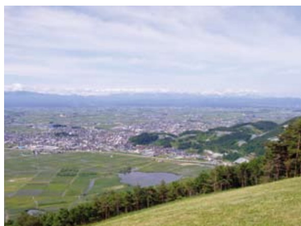
▲南陽市の名所の一つ白竜湖(中央手前) どう、りんご、ラ・フランスなどの果物が自慢です。と き 平成23年11月9日(水)10時～16時

会 場 ちよだプラットフォームスクウェア1F ウッドデッキ(神田錦町3-21)地下鉄東西線 竹橋駅3B出口より徒歩2分 問合せ NPO法人農商工連携サポートセンター ☎5259-8097 【URL】 http://www.npo-noshokorenkei.jp/index.html 後 援 まちみらい千代田ほか キトリ