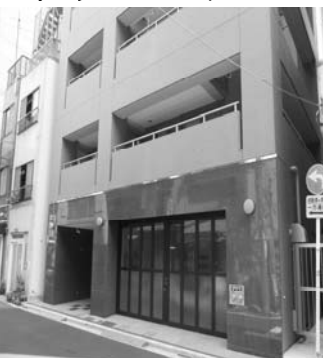
▲木村末廣苑こもれび外神田外観