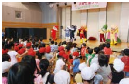
▲子育てまつり(西神田児童センター)