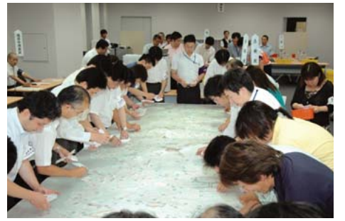
区長選挙の投・開票速報は2月1日(日)に区のホームページでお伝えします