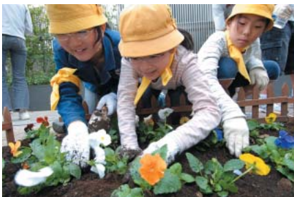
▲九段小児童が花植え(番町学園通り)