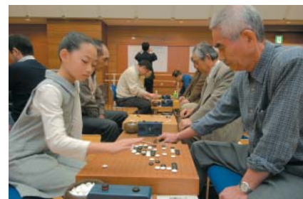
▲囲碁大会(九段生涯学習館)