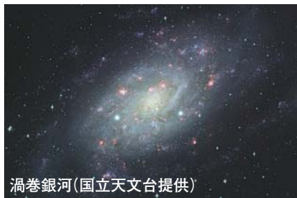
渦巻銀河