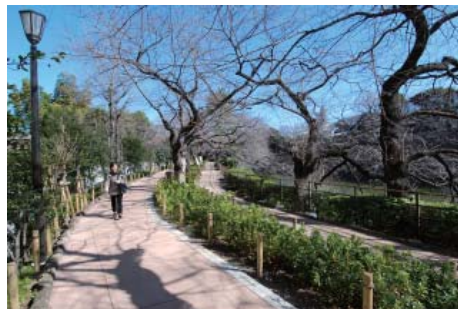
▲新しくなった千鳥ヶ淵緑道「四季の道」