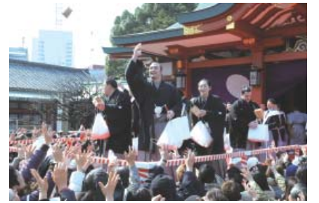
▲節分豆まき(日枝神社)

ノサービス社員) 参加費 1,500円(種・土・プランター代を含む) 申込み 電話・ファクシミリまたはEメール(7面参照)で富士見福祉会館(☎3262-1045 ☎3262-4247) ☎fukushikaikan@city.chiyoda.lg.jp)へ。