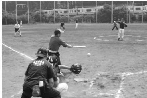
▲地域ふれあいソフトボール大会

4月12日(日)・19日(日)9時~、夢の島東少年野球場(江東区夢の島3)、高校生以上の区内在住者で女性2名を含む男女混成の16チーム(申込順)、参加費=1チーム2,700円(別途傷害保険料1人50円がかかります)、3月26日(木)(必着)までに所定の用紙(文化スポーツ課・スポーツセンター〈内神田2-1-8〉で配布)を郵送またはファクシミリで文化スポーツ課(〒102-8688九段南1-2-1区役所2階 ☎5211-3627 ☎3264-7989)へ。