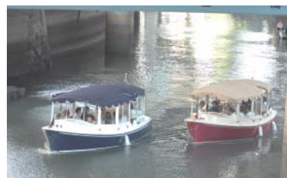
▲清流号(左)とさくら号(右)

3月27日(金)9時30分～12時＝午前コース / 12時30分～15時＝午後コース、区役所4階会議室集合、小学校3～6年生の児童とその保護者各コース12組24名(申込順)、参加費＝1組1,500