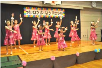
▲つなげよう広げよう異世代の輪 (一番町児童館)