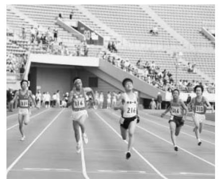
▲小・中陸上競技大会

4月12日(日)9時~、江東区夢の島競技場(江東区夢の島2)、区内在住・在勤・在学者(小学生以上)、種目=トラック・フィールド、参加費=小学生500円/中学生800円/高校生以上1,500円(リレーは1チームあたりの金額)、3月25日(水)(必着)までに参加費を指定口座に振り込み、所定の申込書(スポーツセンター〈内神田2-1-8〉で配布)を千代田区陸上競技協会・渡井(〒330-0064さいたま市浦和区岸町2-4-13 ☎090-2425-5811)へ。