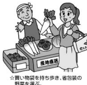
☆買い物袋を持ち歩き、省包装の野菜を選ぶ。

買い物を減らす 買い物袋を持ち歩き、省包装の野菜などを選ぶ 買い物をする場合は、マイバッグ等を持ち歩き、売り場ではレ