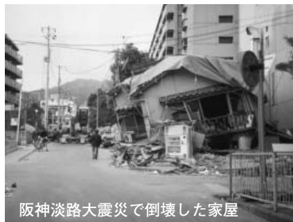
阪神淡路大震災で倒壊した家屋

3月10日(火)～12日(木)10時～18時(最終日は17時まで)、新宿駅西口広場イベントコーナー(新宿区西新宿1西口地下街1号)