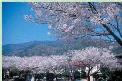
▲湯河原 千歳川沿いの風景

東京よりも標高の高い箱根や嬬恋、軽井沢では、都内より少し遅い春を迎えます。区の保養施設(箱根