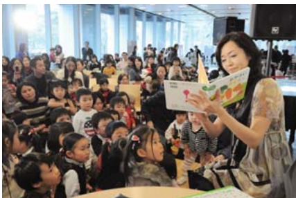
▲子育てハッピーデー (早見優さんと・区民ホール)