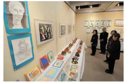
▲エイブルアート(障害者の作品展・九段生涯学習館)