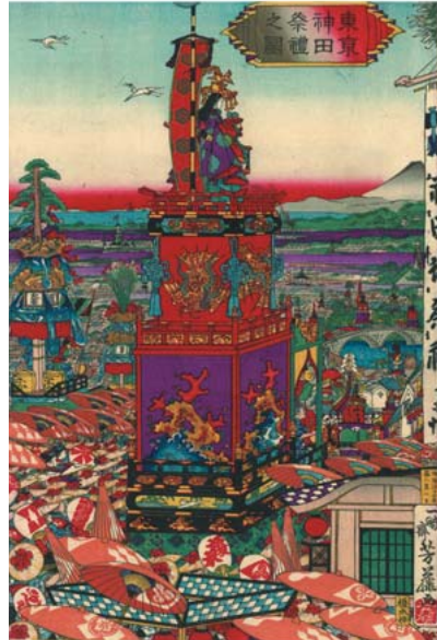
▲「東京神田祭礼之図」芳藤作 千代田図書館所蔵