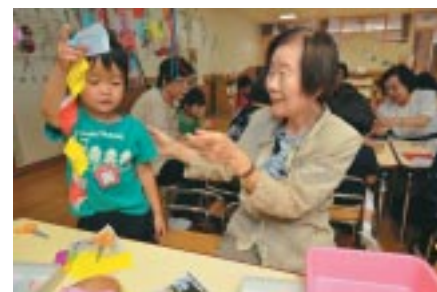
▲七夕会（千代田幼稚園）