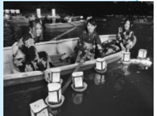
▲灯ろう流しの様子

最新号は8月10日(月)~16日(日)に放映します。 ※開局地域で、ケーブルテレビに加入している方がご覧になれます。 問合せ 広報広聴課 ☎5211-4174 URL http://www.city.chiyoda.lg.jp