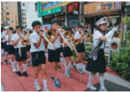
▲お茶の水小マーチングバンド(靖国通り)