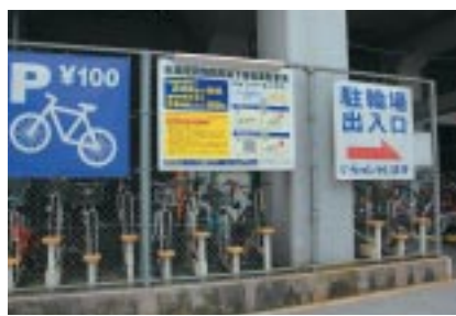
▲秋葉原コインパーキング(西側JR高架下)

場所 水道橋駅東口、秋葉原駅 東側駅前広場、西側JR高架 下、中央口高架下 収容台数 水道橋東口 44台、 秋葉原東側 127台、西側 70台、中央 80台