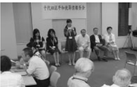
▲昨年の報告会の様子

が沖縄・広島・長崎を訪問しています。 その団員が、現地でも自ら体験したことを伝える報告会を行います。平和使節団の活動に興味のある方や来年この事業に応募したい方など、気軽にご参加ください。当日直接会場へ。 とき 8月19日(水)18時30分～20時30分 会場 401会議室(区役所4階) 問合せ 国際平和・男女平等人権課 ☎5211-4165