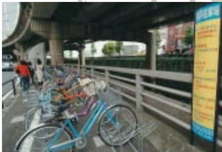
▲九段下駅第2自転車駐車場