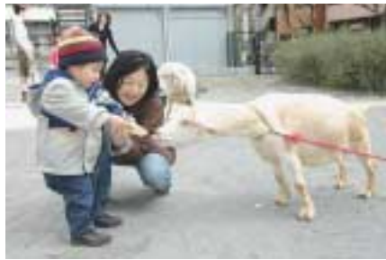
どうぶつ村(麴町保育園)