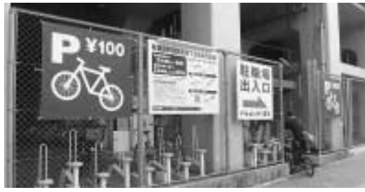
秋葉原駅西側高架下コインパーキング