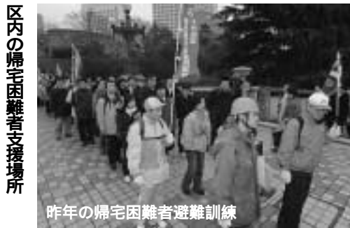
昨年の帰宅困難者避難訓練

製品に添付された取扱説明書や器具本体に表示された注意事項をよく読む。もし製品に異常を感じたら、速やかに使用を中止し、メーカーに相談する。