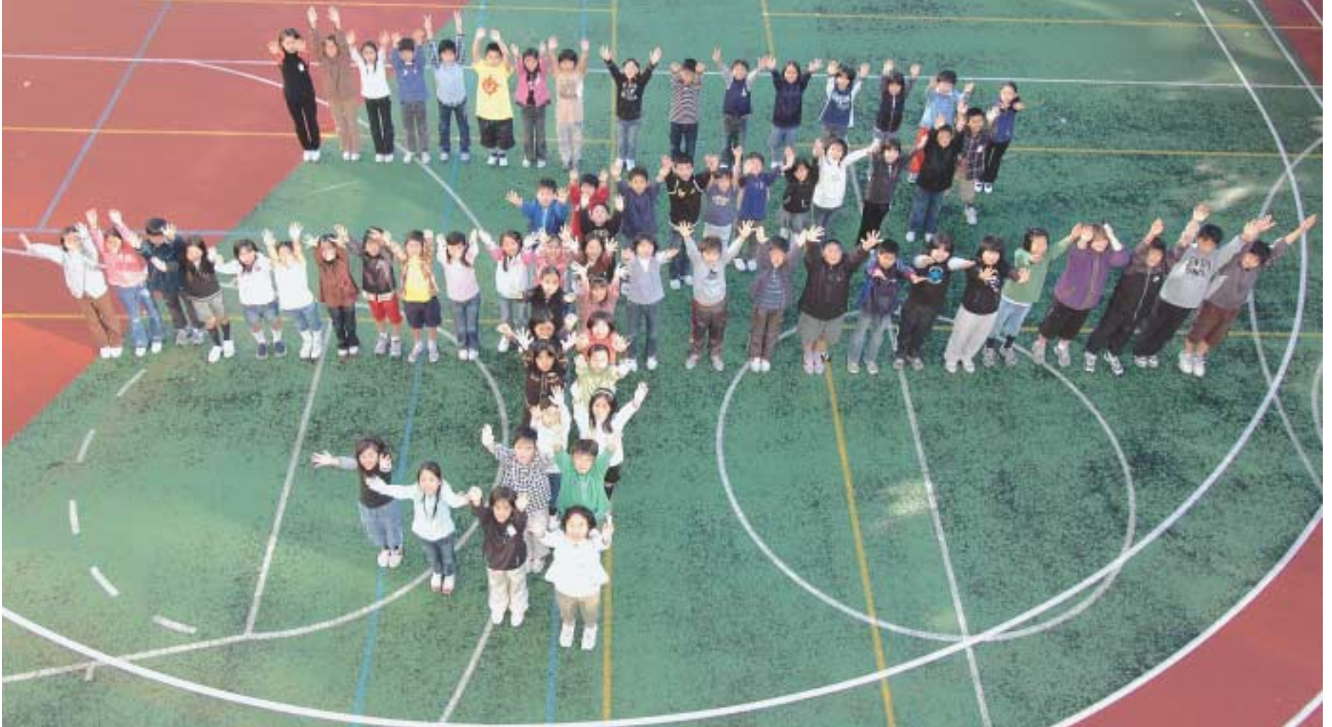
富士見小学校5年生(ねずみ年・うし年生まれ)の皆さん