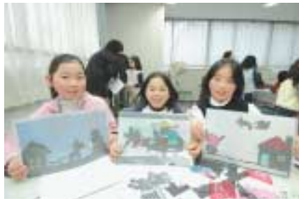
ペーパースタンドグラス教室 (九段生涯学習館)