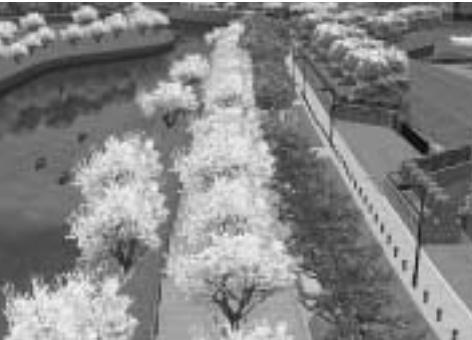
千鳥ヶ淵四季の道(イメージ図)

千鳥ヶ淵緑道を歩きやすく、ゆとりある散策空間に整備する「千鳥ヶ淵四季の道整備工事」は、来年3月に完成予定で現在、工事を行っています。 工事中は歩行者の安全確保のため、一部通行止めにして作業を行います。 なお、さくらが咲いている期間は工事を休止し、鑑賞できるようにします。 皆さんには、大変ご迷惑をおかけしますが、工事へのご理解とご協力をお願いします。