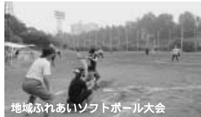
地域ふれあいソフトボール大会

4月6日(日)・13日(日)9時～、夢の島東少年野球場(江東区夢の島3) 高校生以上の区内在住で女性2名を含む男女混成の16チーム(申込順) 費用=1チーム2,700円(別途傷害保険料1人50円がかかります) 3月19日(水)までに所定の申込書(文化スポーツ課・スポーツセンターで配布)を郵送またはファクシミリで文化スポーツ課(〒102-8688九段南1-2-1 ☎5211-3627 ㉠3264-7989)へ。