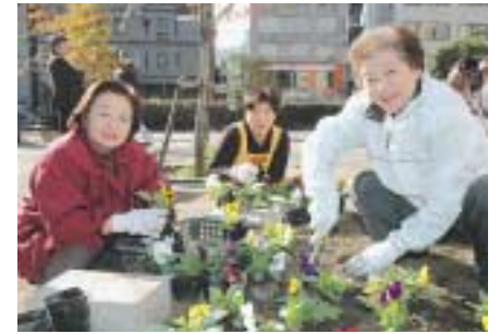
仲よし公園アダプト(花植え)

りをもって介護することの大切さや、高齢者と介護者の権利擁護を学びます。どなたでも参加できます。