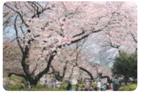
千鳥ヶ淵緑道(さくら特集8面)