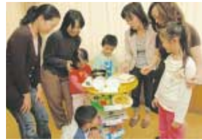
食事バランスごまを見学する親子

31日生のお子さんに、3月末に送ります。転入等で、千代田区発行の予診票がない方はご連絡ください。