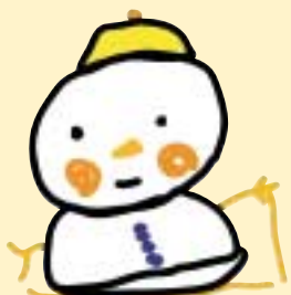
マスコット「ゆっきい」