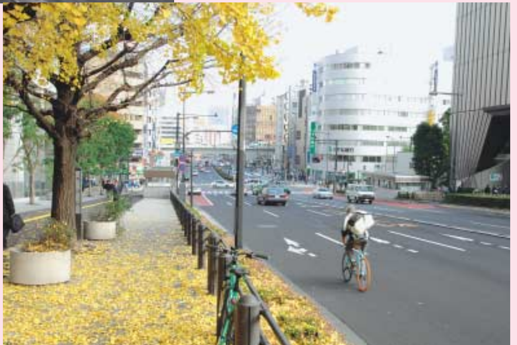
九段坂 昭和32年(上)・平成18年(右) 写真の解説は2面