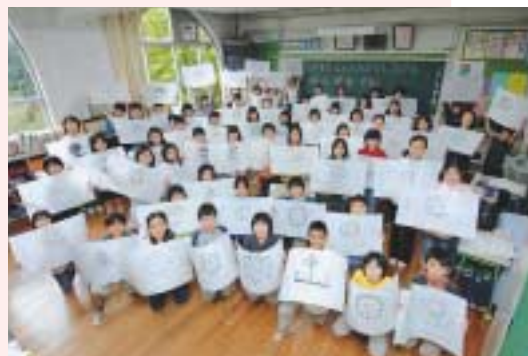
4年生の力作(九段小学校)

和田倉噴水公園に飾られた地球・環境・平和をテーマに描いた675個の明り絵づくりに、区内の8小学校の児童537名も参加。文化人やスポーツ選手ら138名の作品とともに、幻想的な世界を創り出していました。