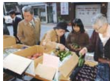
野菜を売る体験学習(神田ふれあい通り)