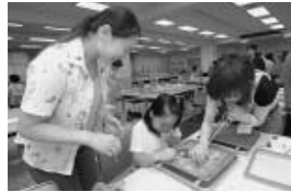
創作和紙アートのワークショップ（旧練成中学校）

で0.41%引き下げました。また、退職手当は、在職中の役職に応じた支給ができるように改正しました。 損害賠償請求事件に関し専決処分により和解した件について（報告）