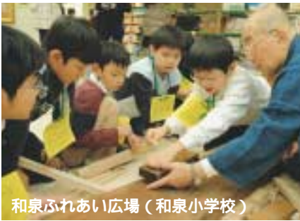
和泉ふれあい広場(和泉小学校)