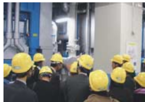
丸の内熱供給施設の見学

まちみらい千代田の賛助会員を対象とした施設見学会を、11月28日に開催しました。今回の見学会には16名が参加、東京電力の給電指令所や丸の内熱供給施設・屋上緑化などを見学しました。見学者からは、「普段見られない施設が見学できた」「ビジネス街の防災・環境対策が理解できた」「次回もおもしろい見学会を開催してほしい」などの感想をいただきました。