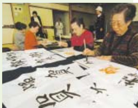
昨年のおたのしみ会