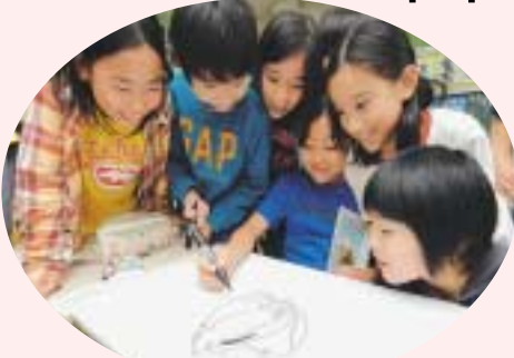
トキに思いを(九段小学校)

照明デザイナー石井幹子さんの企画・監修に参加した児童たちは「スポーツ選手と一緒に自分の作品が飾られてうれしいです」「ゆらめく明りをたくさんの人が見ていてちょっとドキドキしました」「環境への思いを込めて絵を描きました。作品を見た人も地球や自然のことを感じてくれるといいなあ」と話していました。