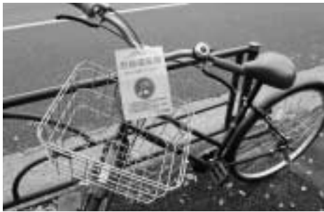
写真はイメージで、実物とは異なります。

実施方法 警告から2時間以上経過した放置自転車にイエローカードを取り付けます。施錠式のため取り外すには、業務時間内に区役所または自転車保管場所に来ていただきます。