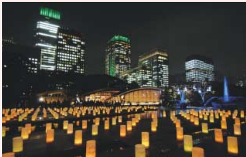
光の競演(和田倉噴水公園と丸の内)

照明デザイナー石井幹子さんの企画・監修に参加した児童たちは「スポーツ選手と一緒に自分の作品が飾られてうれしいです」「ゆらめく明りをたくさんの人が見ていてちょっとドキドキしました」「環境への思いを込めて絵を描きました。作品を見た人も地球や自然のことを感じてくれるといいなあ」と話していました。