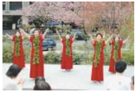
八重桜サンさん祭

助成課に変わります。医療助成費の請求がお済みでない方は、高齢者医療係まで早めに申請してください。