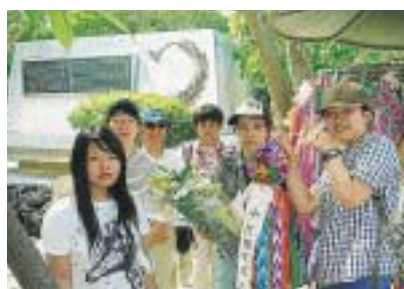
「ひめゆりの塔」の前で献花(沖縄県糸満市)

終戦から62年の歳月が過ぎた今日でも世界の各地で争いが絶えませんが、被爆・戦争体験者も高齢になり、戦争の悲惨さ・過去の戦争のありさまを、戦争体験者から直接聞くことのできる時間も限られてきています。区は、世界の恒久平和を実現するために積極的に行動をしていこうと、平成7年に「国際平和都市千代田区宣言」を行って以来、毎年、平和使節団を沖縄・広島・長崎に派遣