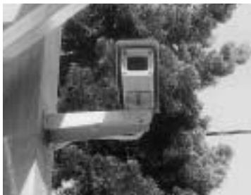
防犯機器設置助成

共同建築や個別建替え・既存ビル活用等を計画している地権者を対象に、相談・助成制度等を紹介します。