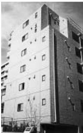
富士見(高齢者)住宅

区営住宅(単身用) 対象 区営住宅(世帯用)の条件(を除外)を満たす60歳以上の方 区営高齢者住宅(単身用) 対象 区営住宅(世帯用)の条件(を除外)を満たす65歳以上の方 詳しくは、5月28日(月)から情報コーナー(区役所2階/日曜を除く)、出張所(土・日を除外)、まちづくり総務課(区役所5階/土・日を除外)