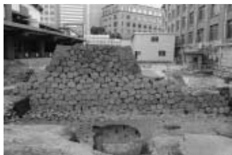
文部科学省内の江戸城外堀石垣