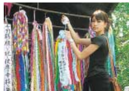
千羽鶴を捧げました(長崎市の山里小学校)

申込み 6月15日(金)必着)までに、封書(7面参照)に、希望する都市(必ず第3希望まで)応募の動機や区が行っている平和事業についてのあなたの考え等(800字～1,200字程度)を記入し、国際平和・男女平等人権課(〒102-8688九段南1-2-1 ☎5211-4165)へ。選考結果は、7月上旬に郵送でお知らせします。