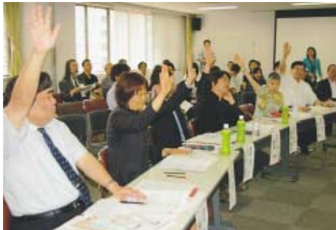
昨年度の公開審査会

5月3日(祝)、5月4日(祝)「大江戸絵巻を歩く」ツアーを実施し、約120名の方が参加しました。 本企画は、千代田観光サポーターが観光資源を発掘し、自分たちの持ち味を活かした観光メニューを企画。皇居・東御苑に最も近いパレスホテルへ提案した結果、実現しました。