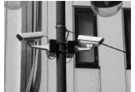
商店街等防犯設備整備補助

安全・安心な商店街を目指すため、防犯カメラの設置等について、費用の一部を補助します。