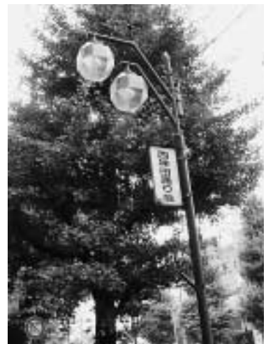
商店街装飾灯の補助