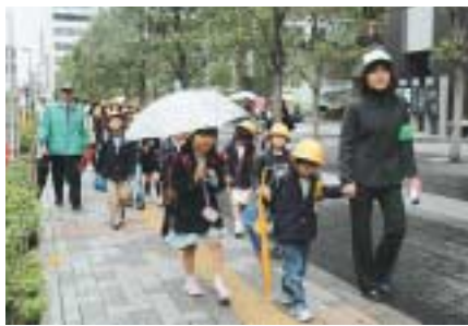
安全・安心一斉パトロール