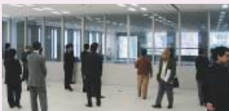
まちづくり施設見学会

千代田のまちづくり活動を応援したい、もっと魅力あるまちにしたいなど、ご興味のある方は、ぜひご参加ください。