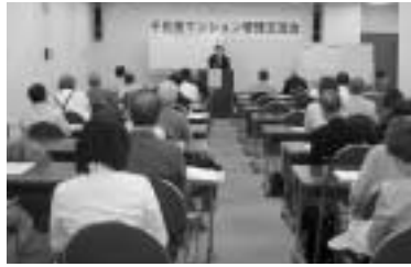
マンション管理セミナー

管理組合やマンション居住者を対象に、マンションの課題をテーマにしたセミナーを開催します。