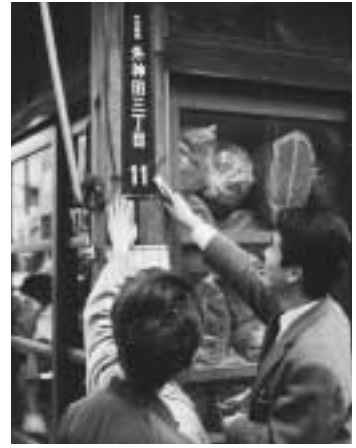
昭和39年 住居表示板の設置

千代田区の住居表示は昭和39年に外神田一丁目目で実施したのが最初で、それから40数年が経過しました。