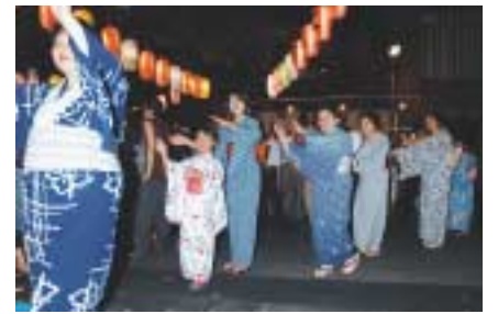
大神宮盆踊り大会(昨年)