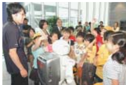
ロボット・アシモと昌平小児童