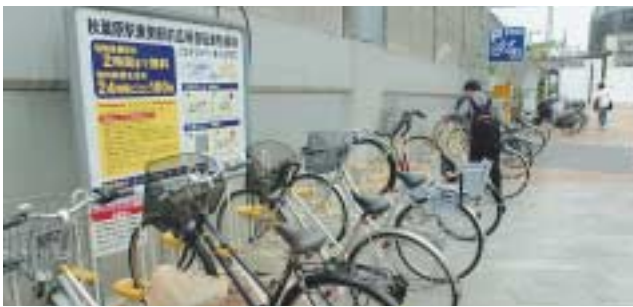
秋葉原駅コインパーキング

駅周辺には数多くの自転車等が放置され、子どもや高齢者・障害者の通行の妨げとなったり、まちの環境・美観を損ねたりしています。区は、14か所の自転車駐輪場(駐輪場)と2か所のコインパーキングをつくり、その周辺を放置禁止区域に指定して、安全で快適な環境づくりに努めています。今回は、区内駐輪場すべての場所と利用方法などを紹介します。 自転車放置禁止区域は区内に8か所 年間7千台を撤去 区内では、JRの駅を中心に8か所の自転車放置禁止区域を定めています。この 区域内で放置されている自転車等は、警告し直ちに撤去します。また、それ以外の区域でも長時間放置されている場合は、警告し撤去します。 昨年撤去した自転車等の総数は、約7千台になりました。引取りには、撤去料「2面参照」が必要になりますので、ご注意ください。 年間登録制の駐輪場 駐輪場の場所は、左図表のとおりです。利用料金や利用期間・方法などは2面をご覧ください。 利用期間は、それぞれの駐輪場に異なっています。募集するときには、広報千代田でお知らせします。 時間貸しの駐輪場 秋葉原駅周辺には、これらの駐輪場のほかに、コインパーキング式の駐輪場があります。最 問合せ 安全生活課路上障害物対策係 ☎5211 4345 14か所の駐輪場と 2か所のコインパーキングを設置 初めの2時間までは無料で利用できます。秋葉原周辺への買い物の際には、ぜひご利用ください。