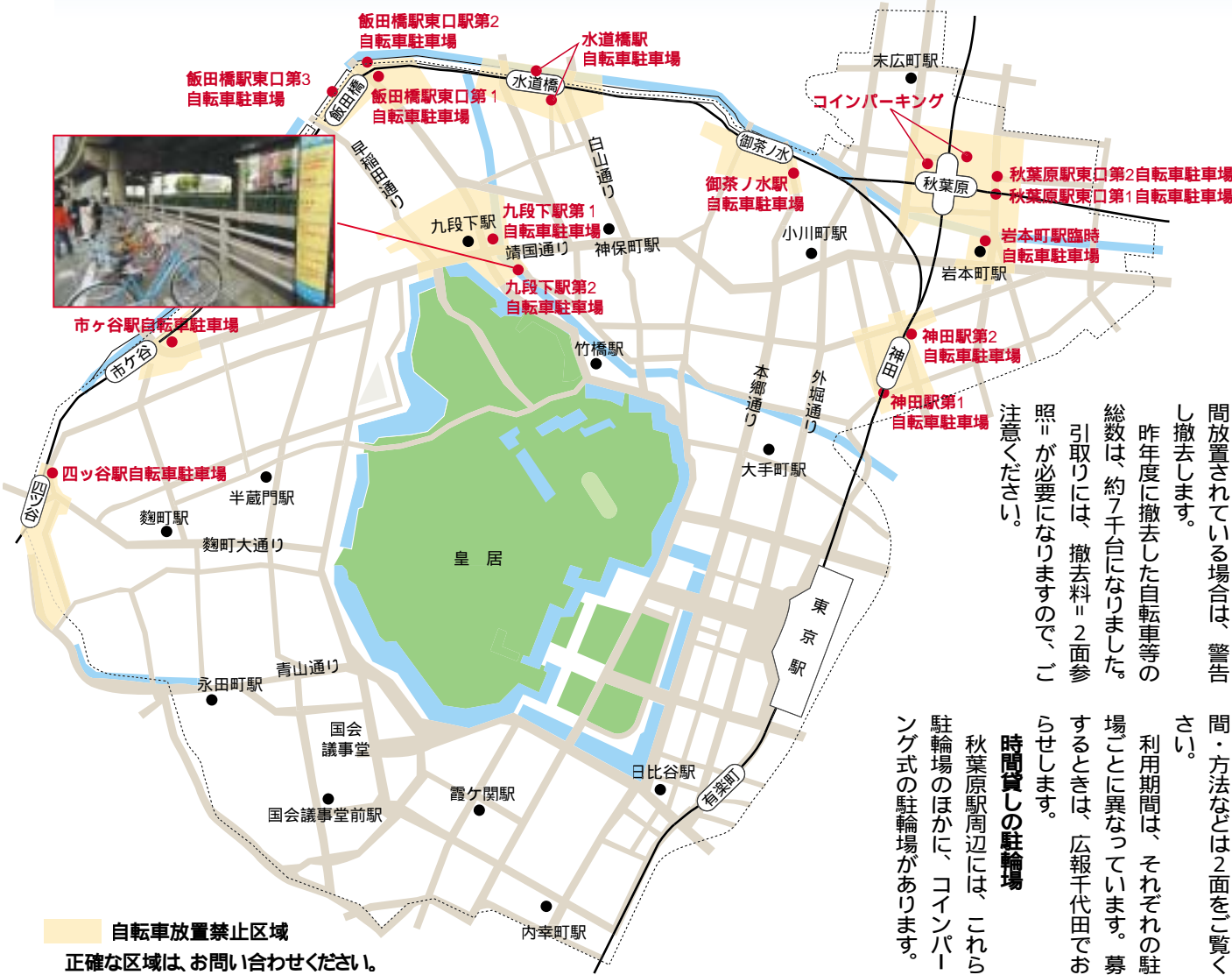
自転車放置禁止区域 正確な区域は、お問い合わせください。

駅周辺には数多くの自転車等が放置され、子どもや高齢者・障害者の通行の妨げとなったり、まちの環境・美観を損ねたりしています。区は、14か所の自転車駐輪場(駐輪場)と2か所のコインパーキングをつくり、その周辺を放置禁止区域に指定して、安全で快適な環境づくりに努めています。今回は、区内駐輪場すべての場所と利用方法などを紹介します。 自転車放置禁止区域は区内に8か所 年間7千台を撤去 区内では、JRの駅を中心に8か所の自転車放置禁止区域を定めています。この 区域内で放置されている自転車等は、警告し直ちに撤去します。また、それ以外の区域でも長時間放置されている場合は、警告し撤去します。 昨年撤去した自転車等の総数は、約7千台になりました。引取りには、撤去料「2面参照」が必要になりますので、ご注意ください。 年間登録制の駐輪場 駐輪場の場所は、左図表のとおりです。利用料金や利用期間・方法などは2面をご覧ください。 利用期間は、それぞれの駐輪場に異なっています。募集するときには、広報千代田でお知らせします。 時間貸しの駐輪場 秋葉原駅周辺には、これらの駐輪場のほかに、コインパーキング式の駐輪場があります。最 問合せ 安全生活課路上障害物対策係 ☎5211 4345 14か所の駐輪場と 2か所のコインパーキングを設置 初めの2時間までは無料で利用できます。秋葉原周辺への買い物の際には、ぜひご利用ください。