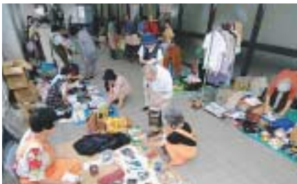
スポーツセンターでのフリーマーケット

9月8日(土)10時～16時、JR飯田橋駅セントラルプラザラムラ1階(飯田橋4-10)区内在住・在勤・在学の個人またはグループ(営利目的の出店不可)出店料=1,500円～2,500円、8月31日(金)必着までに往復ハガキ(7面参照)で神田楽市坐事務局(〒101-0052神田小川町2-10-13 ☎5281-7820)へ。