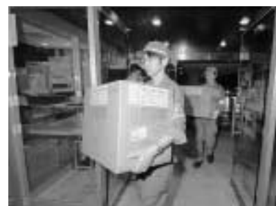
柏崎市役所に支援物資を搬入している様子

さらに、翌日にかけて現地で災害支援を行い、無事帰庁しました。 防災課 ☎5211-4186