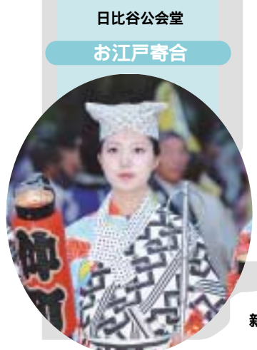
日比谷公会堂 お江戸寄合