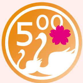
懸賞はがきキャンペーン ロゴマーク

毎年多くのご応募を頂いている「懸賞はがきキャンペーン(500円コイン・ドリーム)」。今年も抽選で、ホテルディナー券や旅行券、グルメギフトなど総額2千万円相当の賞品が当たります。 応募方法 区内の懸賞はがき加盟店で、500円(税込)以上の飲食や買物をすると、懸賞はがきが1枚もらえます。懸賞はがきに必要事項を記入し、加盟店や区出張所にある応募箱、もしくは郵送にて応募ください。おひとり様で何枚でも応募できます。 懸賞はがきの加盟店は、千代田 day@http://www.chiyodadaisy.jp に掲載しています。 配付期間 10月1日(月)～12月14日(金)