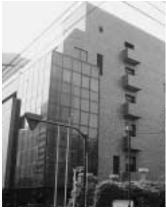
ちよだプラットフォームスクウェア

元三重県知事の北川正恭氏(1階コンシェルジュ)でお申込みください。10月10日締切、定員に達し次第一切とさせていただきます。