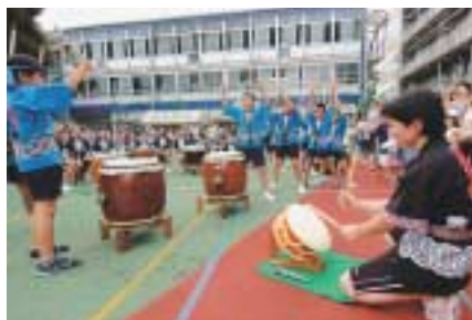
富士見キッズフェス