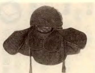
▲火消人足のかぶった頭巾

在勤、在学者30名 受講料 無料(ただし、教材費3千円) 申込み・問合せ 往復ハガキに、「ドイツ語入門」、氏名、住所、年齢、電話番号(在勤、在学の方は、名称、所在地、電話番号を追記)を書いて、9月3日(土)までに、生涯学習振興課へ。