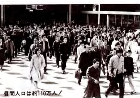
昼間人口は約110万人

「区のおしらせ」では、この財政問題をはじめとして、区民にとつての重要な問題や身近な問題などをこれからも取り上げ、みなさんとともに考えていきます。ご意見、ご感想を広報課までお寄せください。