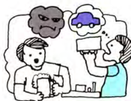
事故をよぶ 酒が 疲労が スピードが

七月二十八日から八月一日までの五日間「夏の全国交通安全運動」が、今回初めて実施されます。 歩行者のみなさんも、運転者のみなさんも、交通ルールを守って交通事故を防ぎましょう。