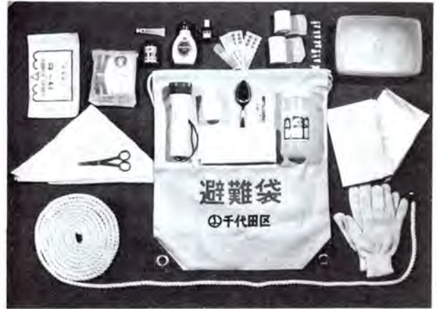
避難袋内容物品一覧表