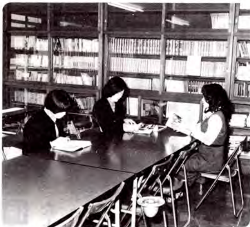
商工青少年ホール一覽