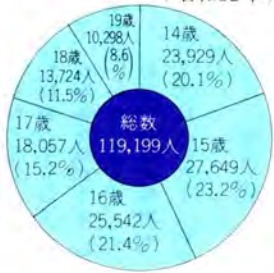
刑法犯少年の年齢別構成 (昭和52年)

これは少年人口千人当りで見ると、十二・四人が非行をしていることになり、成人の場合のちょうど四倍になります。