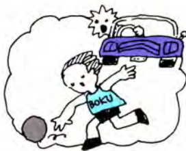
あぶないぞ よそ見 とび出し 事故のもと