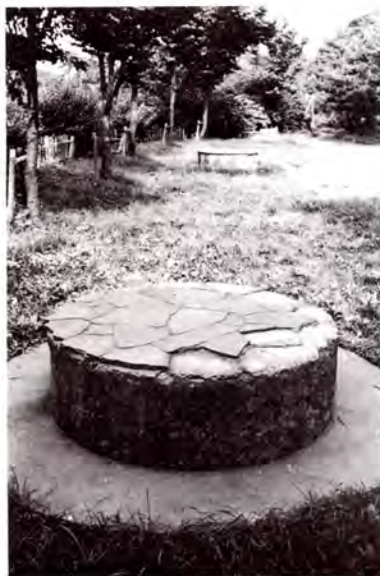
代官町通り土手道に残る高射機関砲の台座