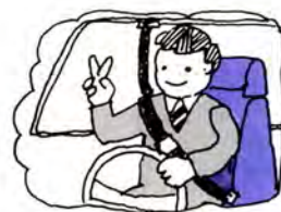
シートベルト 着けるゆとりが 身を守る