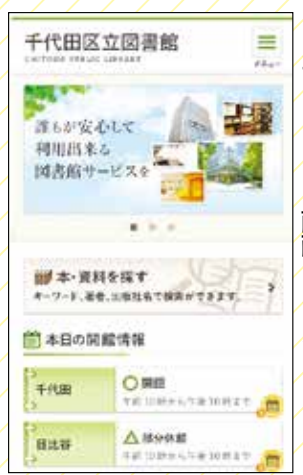
スマートフォン画面イメージ

■千代田 Web 図書館が見やすく 音声読み上げに対応し、文字の大きさ、背景の色が変更できます。