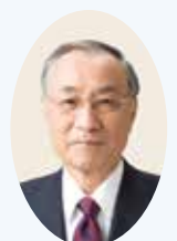
千代田区長 石川雅己

※平成30年度一般会計予算(案)の額を施策分野ごとに、平成30年1月1日現在の住民基本台帳人口61,269人で除して算出した額です(千円未満は四捨五入)。