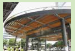
▶ドライ型ミスト (有楽町駅前広場)