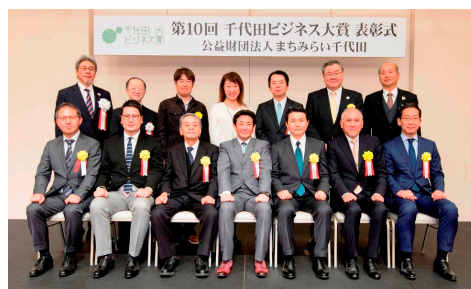
▲第10回千代田ビジネス大賞表彰企業

対象 都内に主たる事業所を有し、自社技術等を活用して、新製品・自社製品の開発を目指す中小企業 ※支援対象製品についての詳細は担当まで 場所 (公財)東京都中小企業振興公社 城南支社・多摩支社 費用 1社7万円 募集期間 平成30年4月募集開始予定 問合せ (公財)東京都中小企業振興公社城南支社 経営支援係 ☎ 3733-6284 http://www.tokyo-kosha.or.jp/support/shien/seminar/dojo.html