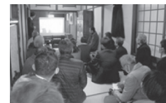
▲見学会などで「海老原商店」の歴史や保存改修の経緯を説明

昨年3月、地域に向けて「竣工お披露目会」が行われました。入口の扉はすべてオープンにでき、入ってすぐの天井の高い土間空間はまちのコミュニティスペースとして多様な活用が期待されます。2階に上がると畳間が奥へと続き、都心のけん騒から離れてゆったりとした一時を感じられます。