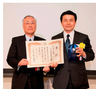
▲千代田区長賞受賞 株式会社豊島屋本店