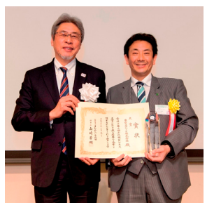
▲大賞受賞 東京スクリーン株式会社