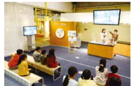
▲がすてなーに ガスの科学館

☎3251-0566 FAX 3251-4627 ✉ seisoujimusho@city.chiyoda.lg.jp 〒101-0021 外神田1-1-6 他①持ち物=お弁当、飲み物②服装=動きやすい服装、運動靴