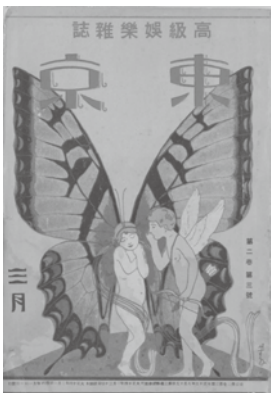
杉浦非水「東京」(第2巻第3号) 1925(大正14)年