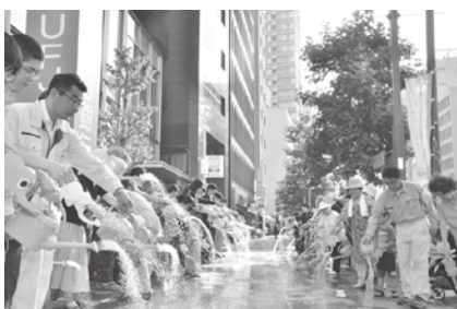
▲麴町大通りの打ち水