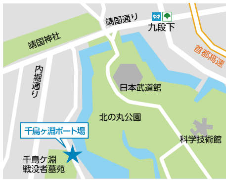
▲九段下駅から徒歩で約10分