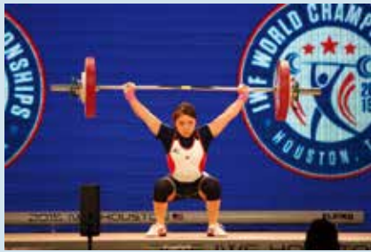
▲ウエイトリフティング

区内で開催される競技の魅力を、オリンピックなどアスリートたちによるデモンストレーションを交えて分かりやすく紹介します。