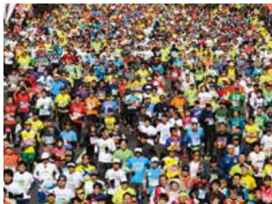
▲(第8回)千代田区民賞「完走を狙って！」