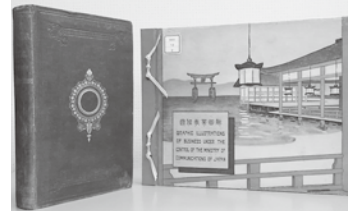
左から「Japan, the Amoor, and the Pacific」、『通信事業図解2』