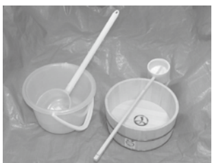
▲木おけ・ひしゃく・バケツ

打ち水は、自然の気化熱を利用して気温を下げる、昔からの手法です。ヒートアイランド現象によって暑くなった都心を冷やし、節電にもつながります。