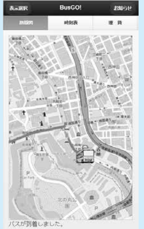
▲新システムの画面イメージ