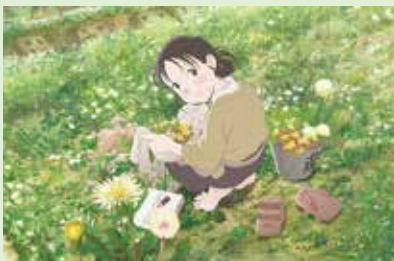
▲◎この史代・双葉社/『この世界の片隅に』製作委員会