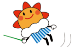
▲気象庁マスコット「はれるん」

時7月23日(月)～10月27日(土) 場千代田図書館展示ウォール(区役所9階) 内気象庁の「気象観測」の仕事や、場所ごとにパネルで紹介。観測機器など気象庁所蔵の貴重な資料の展示や、関連する本の貸し出しもあり 問千代田図書館☎5211-4289