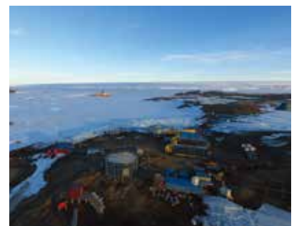
▲昭和基地

☎https://www.library.chiyoda.tokyo.jp 他手話通訳を希望する場合は、8月31日(金)までに問合せ先へ