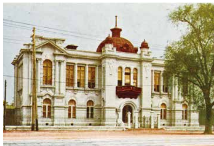
▲東京市立日比谷図書館

明治41年に開館し、当時12万500冊の蔵書がありました。専門性の高い帝国図書館に対して、市民に開かれた図書館を目指しました。