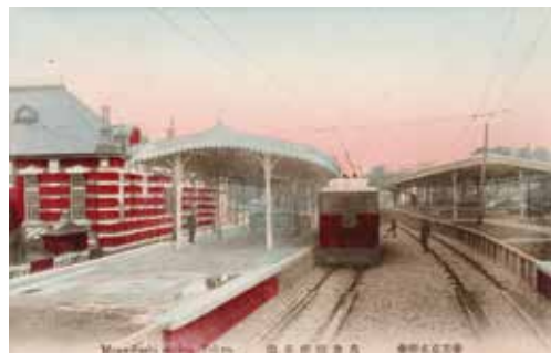
◀万世橋駅ホームと線路 (千代田区教育委員会蔵)

明治30年代の石版画で、奥には桜田門が描かれています。司法省は旧法務省本館として現存しています。