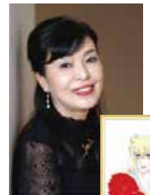
池田理代子プロダクション

締9月18日(火)までにファクスまたはEメール(1人につき1名分の応募/5面記入例参照)でMIW(FAX 5211-8846) miw@city.chiyoda.tokyo.jp)へ