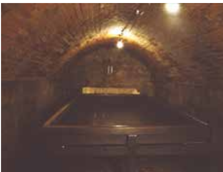
▲糴室(千代田区教育委員会蔵)