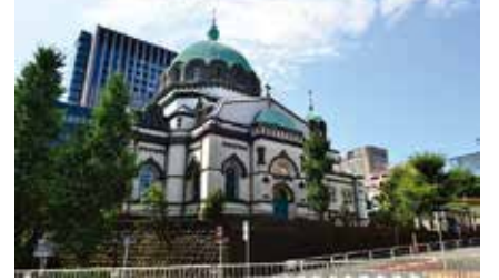
▲現在のニコライ堂