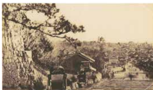
◀明治20年頃の九段上から見た神田

万世橋駅のホームは高架上に2本あり、4線が乗り入れていました。当時ホームだった場所は現在カフェになっており、中央線を間近で見ることができます。