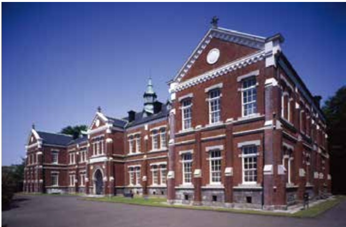
▲外観(東京国立近代美術館工芸館提供)

明治43年3月、近衛師団司令部庁舎として建築されました。丸の内や霞ヶ関の明治洋風煉瓦造の建物が急速に消滅していくなかで、官庁建築の古い様式をよく残しており、日本人技術者が設計した現存する数少ない遺構として重要な文化財です。