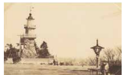
九段坂公園の燈籠(千代田区教育委員会蔵)

写真は、大正時代に撮影されていますが、いずれも明治期の建物です。警視庁が有楽町にあったことが分かる貴重な写真です。