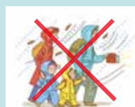
▲見通しが悪い中での避難は危険

夜間で見通しが悪いときやすでに浸水が始まっている場合は、無理して避難所などへ行かず、丈夫な建物の3階以上または自宅の上階に避難しましょう。また、夜間に大雨が予想される場合は、明るい時間帯に早めに避難所へ避難しましょう。