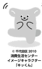
千代田区2010消費生活センターイメージキャラクター「キックン」