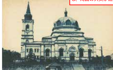
▲竣工当時のニコライ堂 (千代田区教育委員会蔵)

大正12年の関東大震災で鐘楼上部が崩落しました。石組基礎と煉瓦造の壁を残しながらも、周囲の火災が燃え移りドームはじめ金物・内装全てを焼失しました。