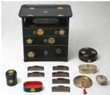
▲和宮婚礼道具「櫛台」(徳川記念財団蔵)