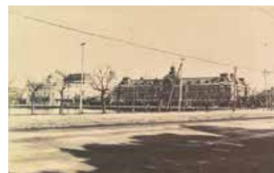
帝国劇場と警視庁

写真は、大正時代に撮影されていますが、いずれも明治期の建物です。警視庁が有楽町にあったことが分かる貴重な写真です。