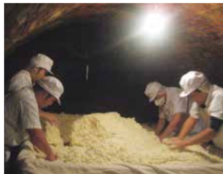
▲作業の様子(千代田区教育委員会蔵) 天野屋提供