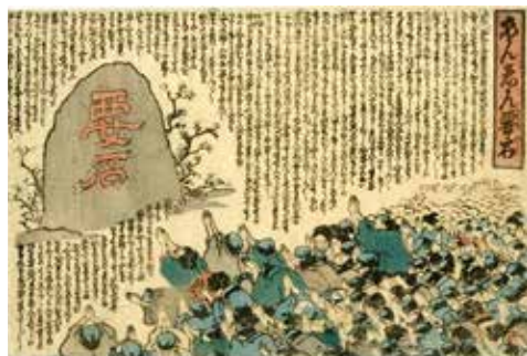
▲安政大地震後瓦版「あんしん要石」