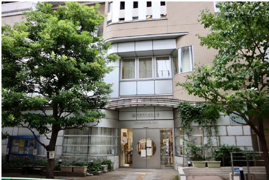
神保町にたたずむ千代田区神保町出張所

保町の方々とつながりを持ち、町の声を聴きながら、神保町の街づくりに関わっていきたくて思いました。