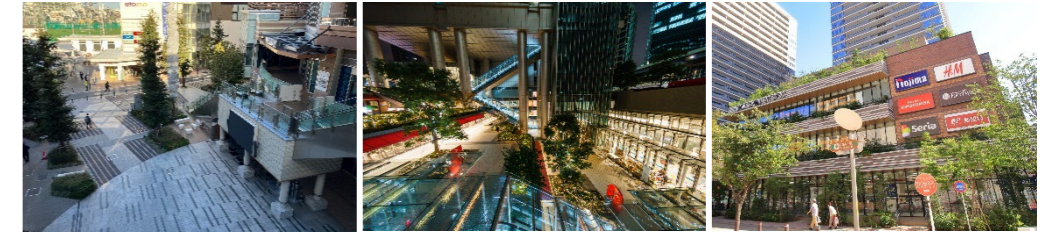
駅前の滞留空間 地下鉄からのバリアフリー動線 生活拠点機能の整備