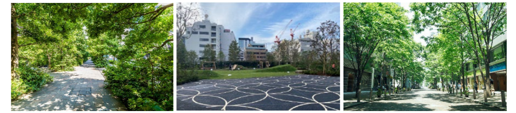
外濠の環境を楽しめる空間 まちなかの緑・オープンスペース 沿道の緑化