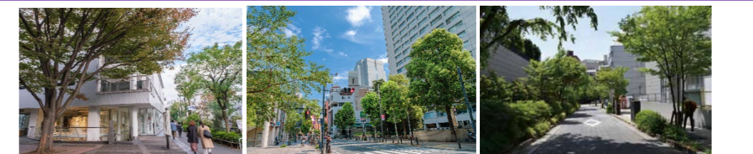
提供：ピクスタ (アイデア/PIXTA) 提供：ピクスタ (アイデア/PIXTA) 出典：千代田区緑の基本計画 (R3.7) 通りの特色を活かした空間形成