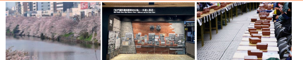
見附跡としての歴史の継承 地域資源等の魅力の発信 地域文化の醸成