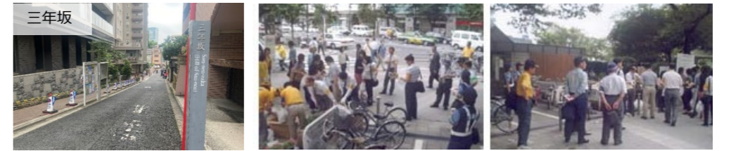
安全な道路空間 地域の防災性向上 駅周辺の環境・治安の改善 出典：千代田区HP 出典：千代田区HP