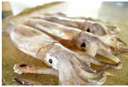
仁科の真イカ しずおか食セレクションに認定されたブランドイカ!

その他 8月23日(金)から、新潟県糸魚川市とのグルメフェアを開催予定。詳しくは、広報千代田8月20日号でお知らせ