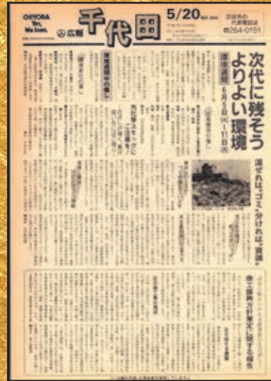
▲第800号 平成2年5月20日発行