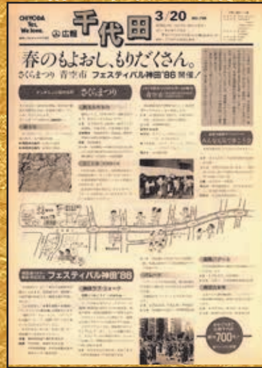
▲第700号 昭和61年3月20日発行