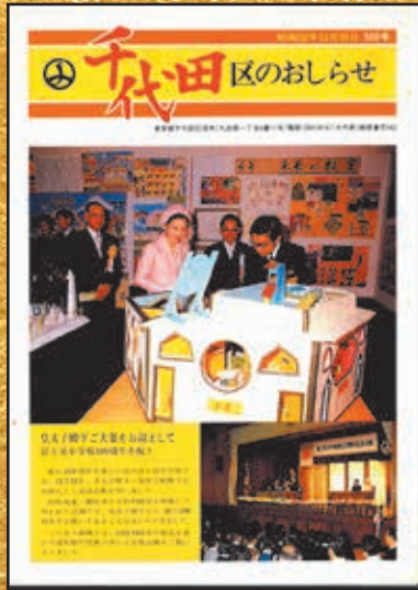
▲第500号 昭和52年11月20日発行