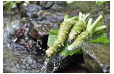
生わさび 世界農業遺産に認定された静岡水耕わさび!