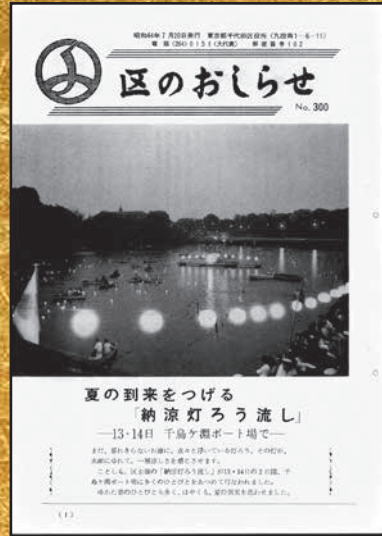
▲第300号 昭和44年7月20日発行