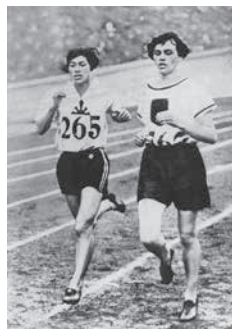
▲アムステルダム1928オリンピックの人見絹枝選手(左)

https://www.mainichi-ks.jp/form/talk0802