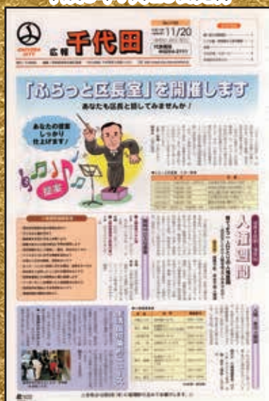
▲第1100号 平成14年11月20日発行