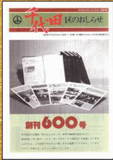
▲第600号 昭和57年1月20日発行