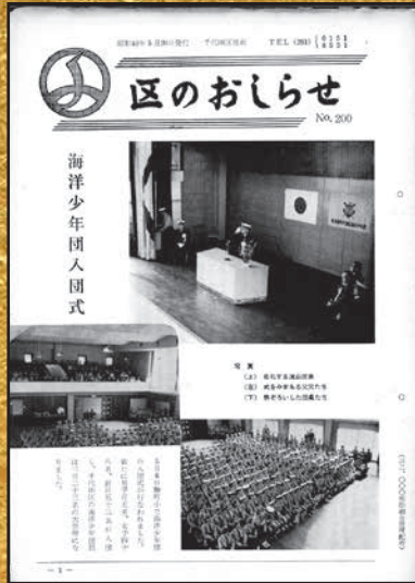
▲第200号 昭和40年5月20日発行