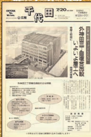
▲第900号 平成6年7月20日発行