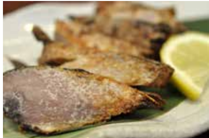
潮かつお 日本で西伊豆町でしか作られていない絶滅危惧食材!