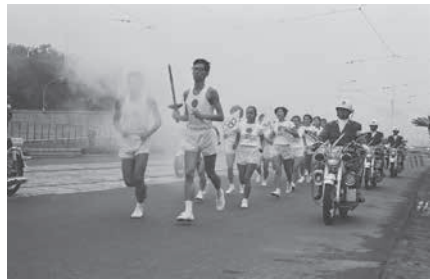
▲1964年の聖火リレーの様子

オリンピック聖火は、2020年3月26日(木)に福島県を出発し、121日間かけて全国を回ります。都内では2020年7月10日(金)に、東京1964オリンピックの会場であった駒沢オリンピック公園中央広場からスタート。多摩地域、島しょ地域、区部の順で巡り、都庁に到着した後、新国立競技場で行われる開会式で聖火台に点火されます。