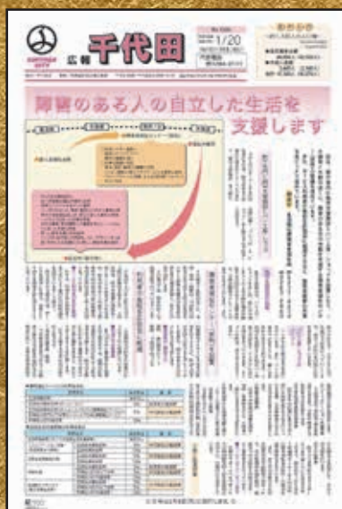
▲第1200号 平成19年11月20日発行