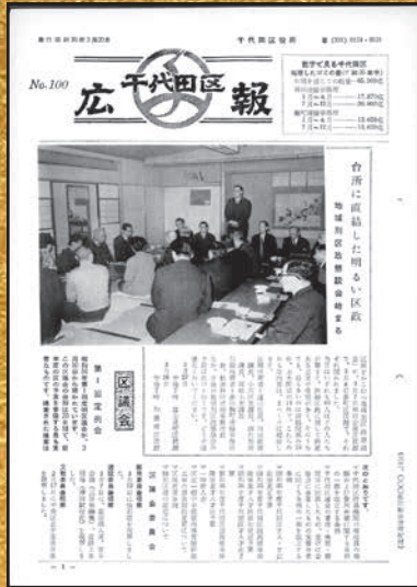
▲第100号 昭和36年3月20日発行