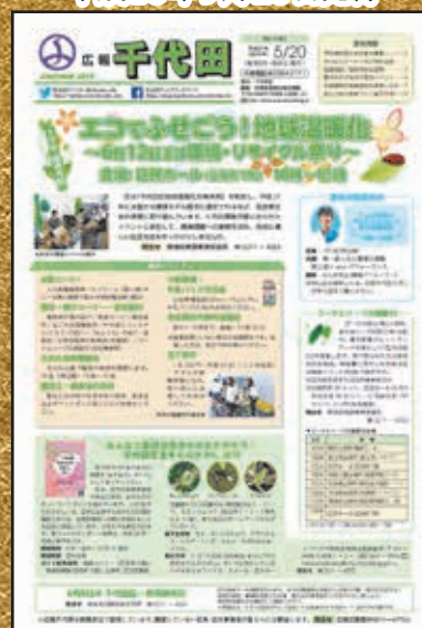
▲第1400号 平成27年5月20日発行