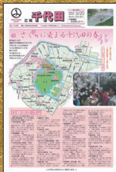
▲第1300号 平成23年3月20日発行