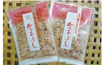
プレゼントの田子箆 伝統の製法で作られる本枯れ節のかつお節!