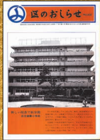
▲第400号 昭和48年9月20日発行