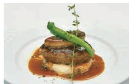
西伊豆産鹿肉のハンバーグステーキ フォアグラ添え(こしょう胡椒)香るソースで(レストラン&カフェ カトレア)