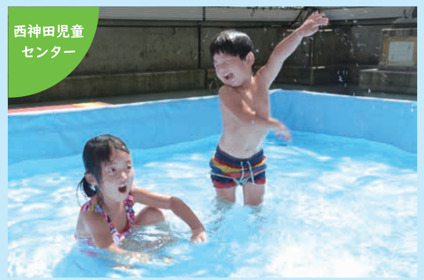
西神田児童センター