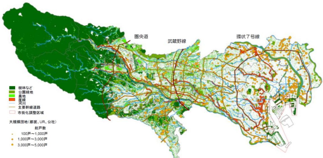
図2 東京のみどり等の現況