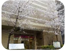
神田さくら館の桜