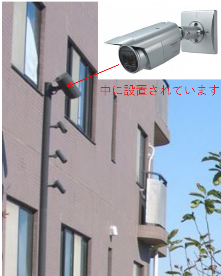
防犯カメライメージ