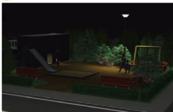
● 不十分な明るさの公園