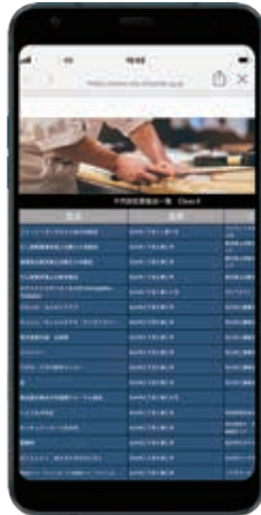
千代田区公式LINEで最寄りの認証店をチェック