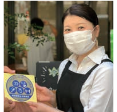
《千代田区飲食店認証制度》

千代田区の認証店は10月20日時点で244店。感染防止対策が施されているかを保健所が直接訪問し、確認のもとで、認証しています。写真はClass II基準(高度)が認定されたトラットリアレモンさん(神田駿河台)と、感染防止対策を伝える店舗のホームページ。