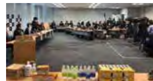
▲協力に関する記者会見の様子

※区はアース製薬株式会社、大塚製薬株式会社と「区民の健康な暮らしを守る連携協定」を結んでいます