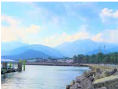
古くは屋久杉の積み出し港として栄えた宮之浦港

そんな屋久島町から、ちよだいちばに地元限定の産品が60品目ほど届きます。地元の郷土食材も当店のご当地弁当に登場する予定です。