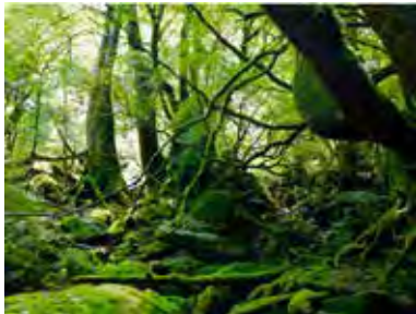
樹齢およそ1000年を超える杉が屋久杉と呼ばれます

屋久島と言えば、皆さん思い出されるのは屋久杉などを始めとした大自然に脈々と生息する動植物の数々ではないでしょうか。うっそうとした森林の神秘的な風景は多くの人たちを魅了し続けています。