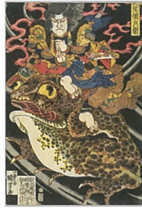
▲歌川国芳「天竺徳兵衛」(後期)

千代田区の誇る質・量ともに豊かな紀伊国屋三谷家コレクションをもとに、当時の人びとにとって身近な鑑賞品であり、時に実用品であった浮世絵を、役者絵、武者絵、美人画、名所絵などを通じて紹介します。