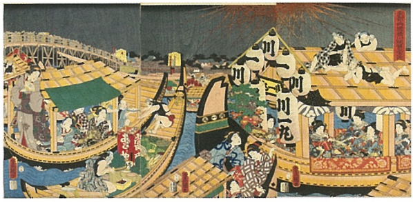
▲三代歌川豊国「東都両国橋川開繁栄図」(後期)