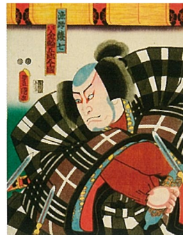
▶三代歌川豊国「四代目村歌右衛門の漁師鱈七実」(金輪五郎今因)(前期)

【会場】千代田区立日比谷図書文化館 1階 特別展示室 【協力】草津街街道交流館 【参加費】無料(特別展の当日観覧券が必要) 【申込】不要