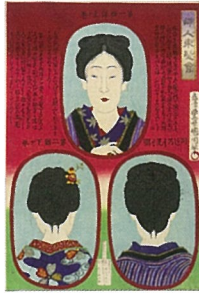
▲豊原国周「婦人束髪会」(前期)