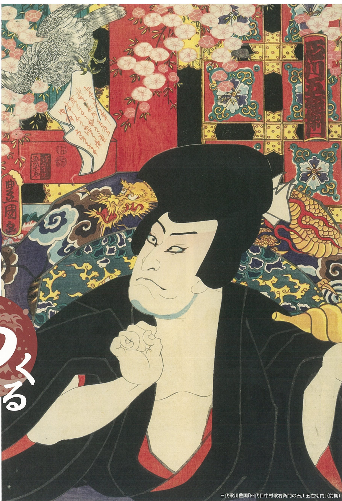
三代歌川豊国「四代目中村歌右衛門の石川五右衛門」(前期)