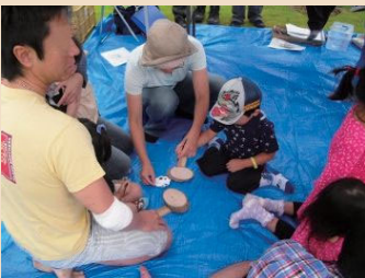
イベントの開催イメージ

小学校低学年以下のお子さんが参加される場合は、保護者の方と一緒に参加をお願いいたします。