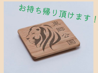
イベントで作るコースター完成イメージ

参加を希望される方は、裏面のイベント参加申込書に記入の上、FAX または必要事項をメールに記入して、下記問い合わせ先まで申込みをお願いいたします。(申込締め切り11月24日(水)まで)