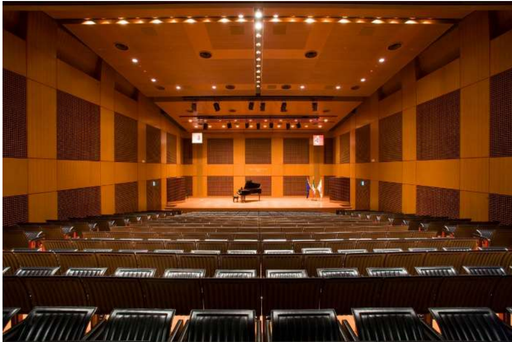
372 席のホール