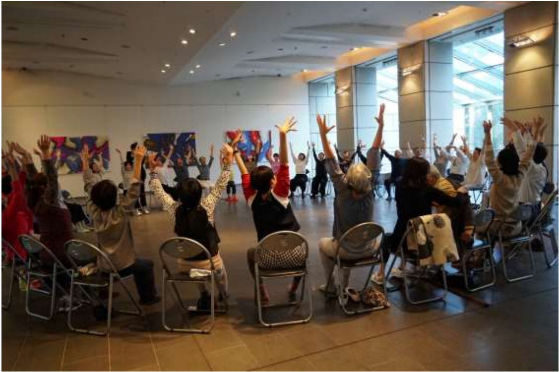
大きなガラスを通して美しい緑を目にすることができる 250mq の展示スペース。