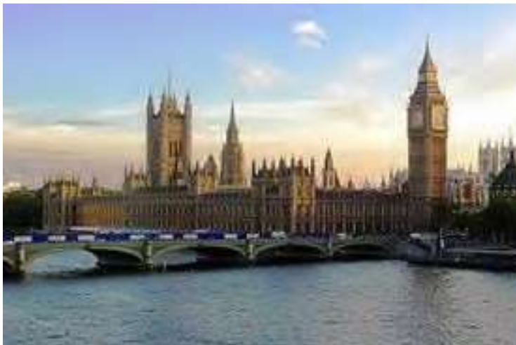
ウエストミンスター宮殿