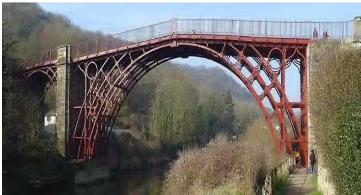
アイアンブリッジ渓谷