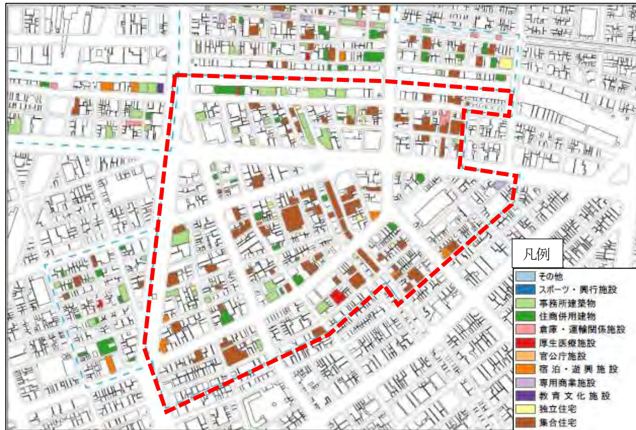
引用元：地区計画受付台帳