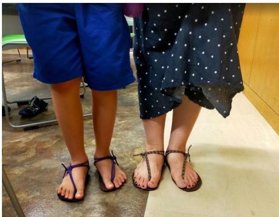
○本イベント(ワラーチ作成イベント)