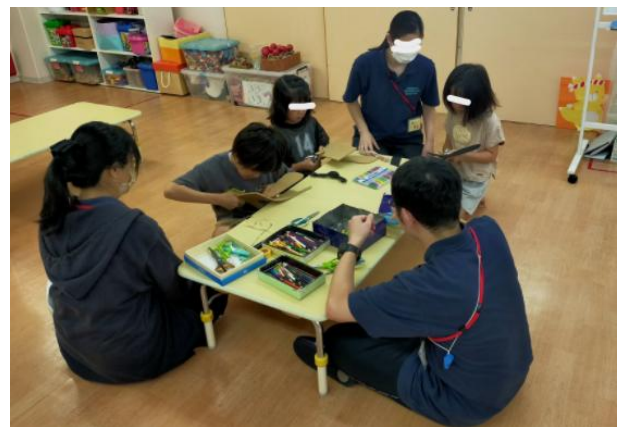
○逃暑中ワラーチ作成(学童イベント)