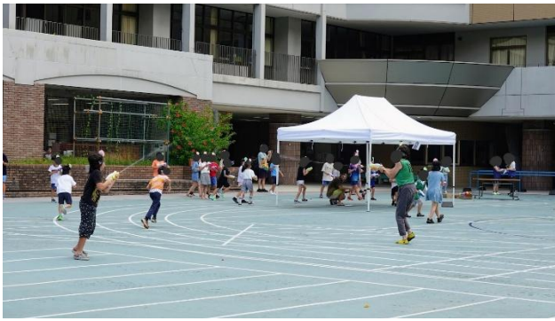
○本イベント(びしょ濡れ逃走バトル逃暑中)