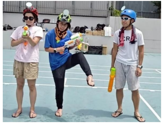
○プレイベント(ちよだスプラッシュ麴町大会)