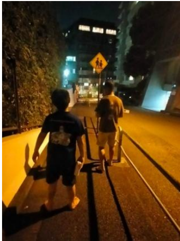
○プレイベント(ワラーチ de 夜散歩)