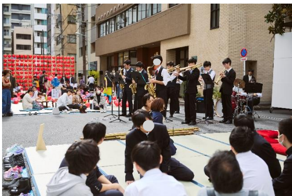
○神田ポートビル前道路でのイベント