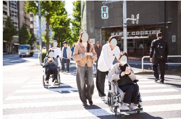
○車いすのイベント